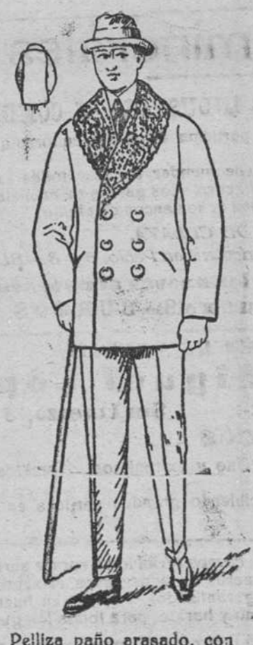
Peliza paño arasado, con piel ó rizo en el cuello, á 40, 50, 60 y 70 pesetas.