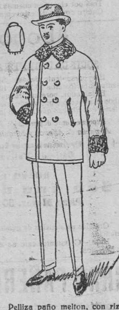
Peliza paño melton, con rizo en el cuello y puños, á 25,30, 40, 50 y 60 pesetas.

Ford EL AUTOMÓVIL UNIVERSAL ENTREGA INMEDIATA