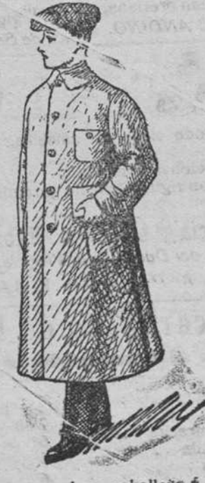
Guardapolvos caballero á 12, 15, 18, 20 y 25 pesetas.