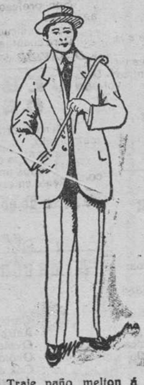
Traje paño melton á 45, 50, 60, 70 y 90 pesetas.