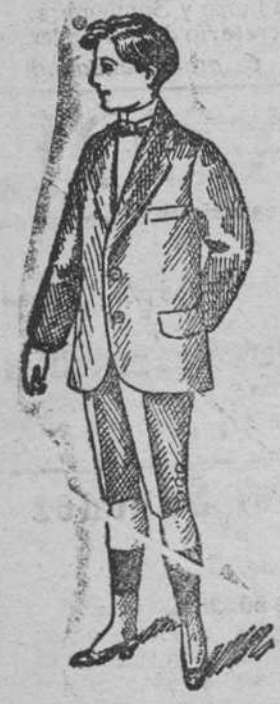
Trajeito para joven á 35, 40, 50, 60 y 70 pesetas.

Plaza Mayor, 42 y Lain-Calvo, 9 TELEFONO 88 :: BURGOS.