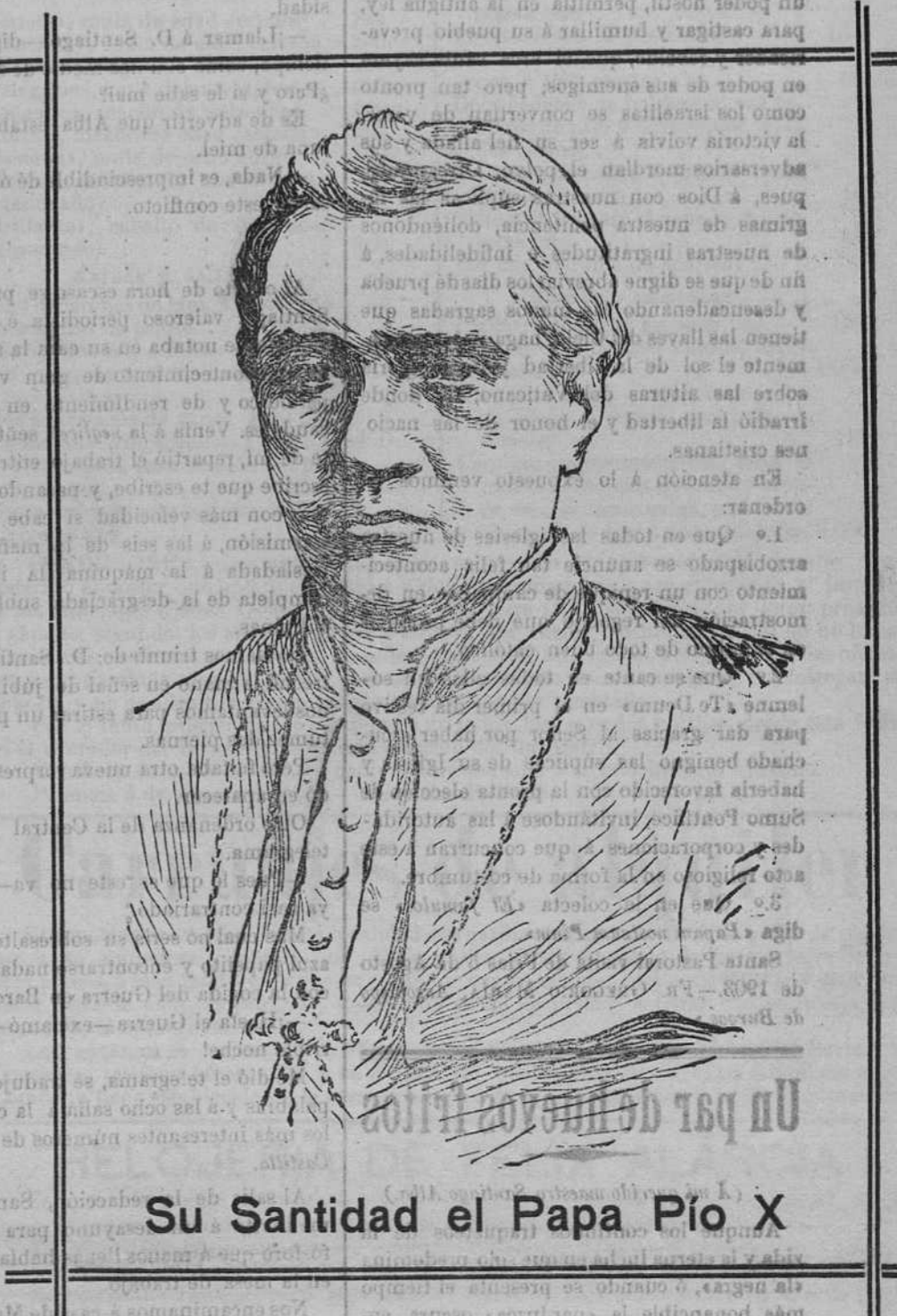
Su Santidad el Papa Pío X

Durante los días 15, 16 y 17, las plazas, paseos y edificios públicos estarán vistosamente iluminados, colocándose además cucañas y elevándose, desde los balcones de la Casa Consistorial, bonitos y variadísimos globos aerostáticos.