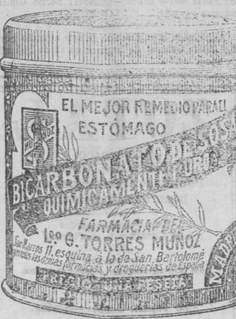
LATAS ECONÓMICAS, Á 5 PESETAS.