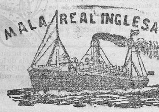
SANTANDER: El 27 de Noviembre el vapor «Ferou» para los puertos de La Guayra, Colón y escalas y puertos del Pacífico, etc.

SANTANDER: El 6 de Noviembre el vapor «Espagne» para Habana y Veracruz.