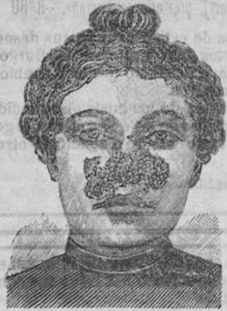
Antes de la curación.

Descubrimientosensacional. Curación de las enfermedades de la piel y también de las llagas de las piernas