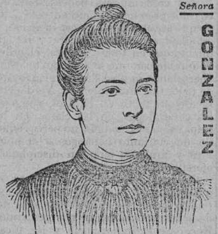
Barcelona 23 de Abril de 1901.