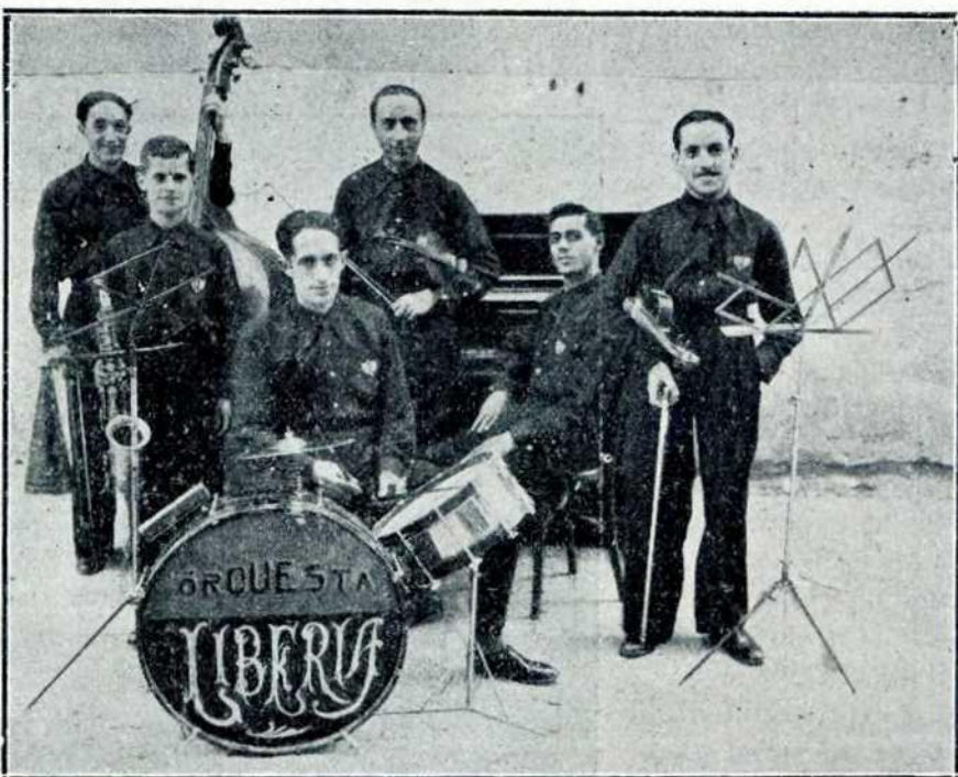
La notable orquesta «Liberia», que en la velada del 23 de septiembre nos deleitó con un magnífico concierto.

A los calurosos aplausos con que el público premió la meritísima labor de músicos y actores unimos el nuestro muy sincero y entusiasta, que hacemos extensivo a la Junta directiva, organizadora de tan simpática velada.