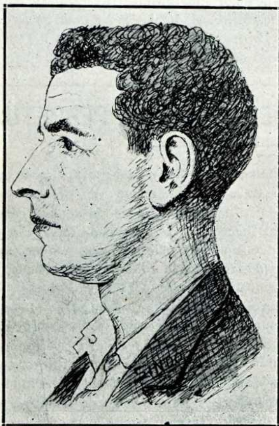
(Dibujo de Pedro Donis)

Estudió para maestro, y al no gustarle estudiar, de oatoros asignaturas aprobó trés nada más.