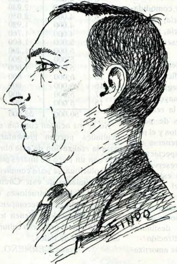
(Dibujo de Pedro Donis)

Con amor y entusiasmo florecientes, en unión de contados societarios, fundó la sociedad de dependientes que gérmen fué de la de Oficios varios.