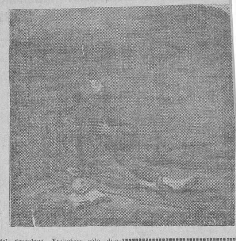
El desenlace. Francisco sólo dijo: —Pues bien venida sea la hermana muerte.

Se hizo trasladar a Portiúncula. Y un sábado por la tarde, el 4 de Octubre de 1226, recitando el salmo 141, rodeado de los hermanos, y cubierto en el suelo de ceniza, entregó su alma a Dios. El 16 de Junio de 1228, Gregorio IX lo canonizó e hizo construir en Asis una basílica donde fué trasladado el cuerpo del Santo muerto.