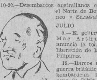
General MacARTHUR, jefe supremo de las fuerzas aliadas en el Suroeste del Pacífico