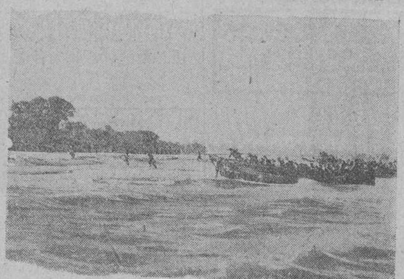
Fuerzas militares británicas en el momento de desembarcar en la isla de Mindanao, durante las últimas operaciones contra los japoneses