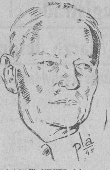
Almirante W. NIMITZ, jefe supremo de la flota aliada en el Pacífico

ABRIL. 1.—Okinawa invadida por los americanos. Este desembarco constituye la mayor operación anfibia en el Oeste del Pacífico. (La resistencia japonesa cesa el 21 de Junio). 5.—Rusia denuncia el pacto de neutralidad ruso-nipón. MAYO. 16.—Desembarco en las Borneo y Mindanao.