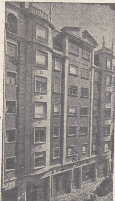
OFICINAS CENTRALES MIRANDA, 5 (Frente a la Estación de Autobuses)