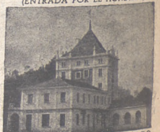
SUCURSAL DEL MERCADO DE GANADOS DE S. AMARO