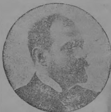
Sr. Fernandez Saw

Estrenada en el teatro de la Zarzuela, la noche del 26 de Junio de 1902.