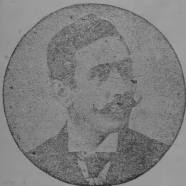
Sr. San José.

se admiten suscripciones a todos los periódicos y Revistas de España y se venden en el Kiosco de Celestino