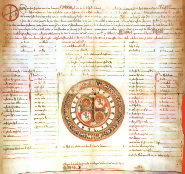
Privilegio rodado de Alfonso X el Sabio concediendo a la Villa de Valladolid dos ferias de quince días: una desde mediados de septiembre y otra a mediados de cuaresma 30-VII-1263.—Se conserva en el Archivo Municipal.