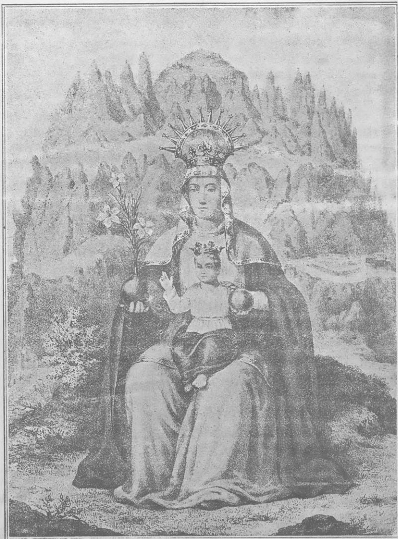
Nuestra Señora de Monserrat, Patrona de los Somatenes, cuya festividad se celebra en mayo