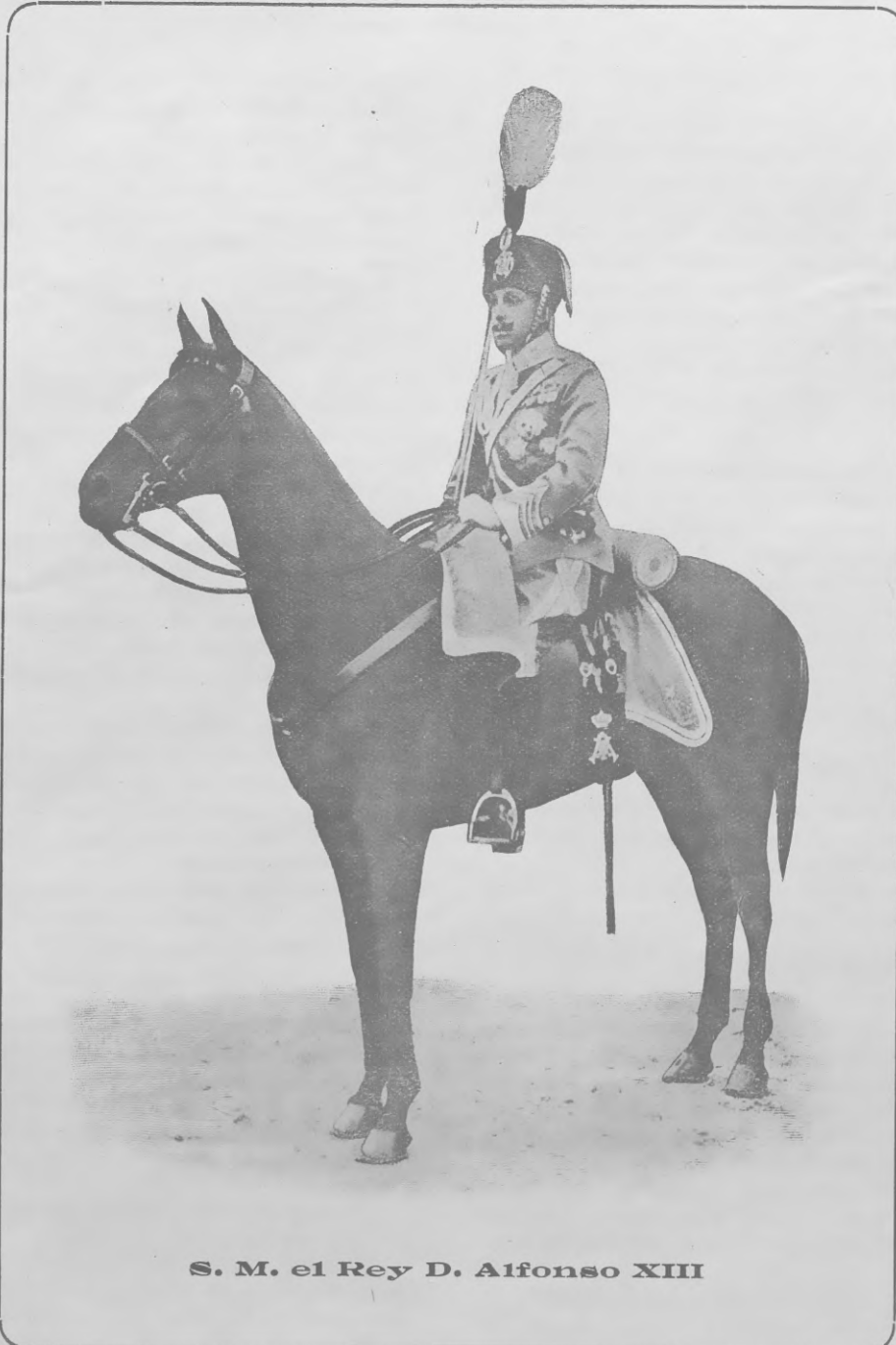
S. M. el Rey D. Alfonso XIII

Precios de suscripción: Un año..... 3'00 pesetas. Número suelto..... 30 —