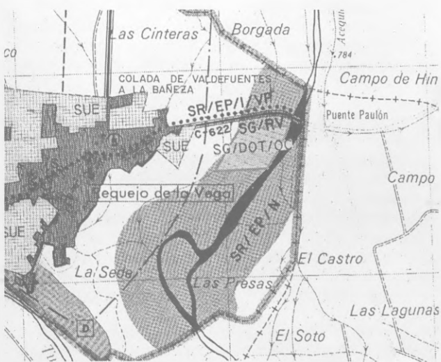
Figura 2. Estado reformado.