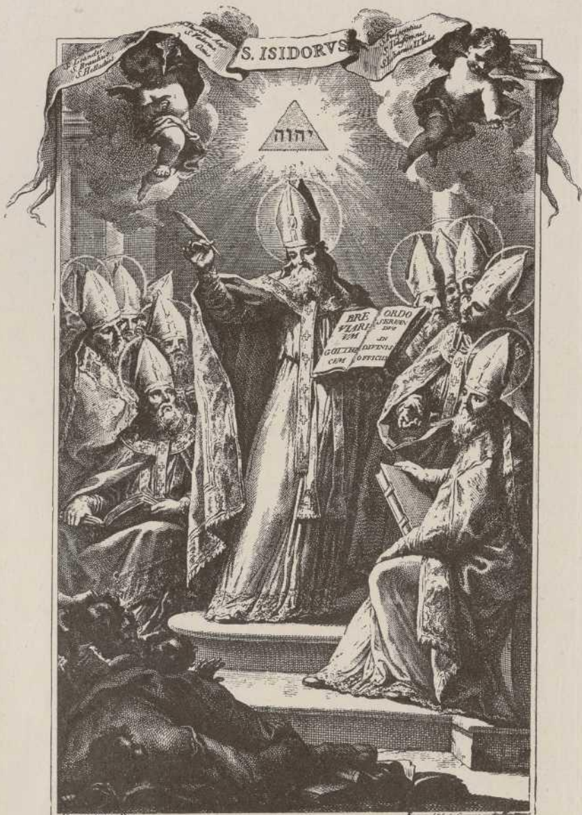
St. Isidore of Seville presiding over a council.