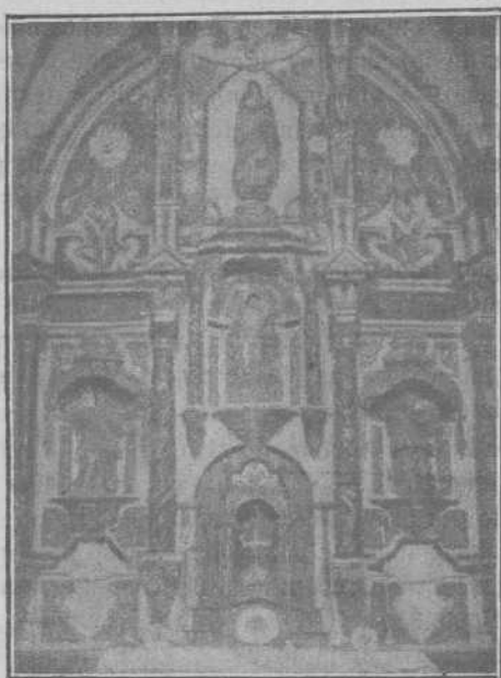
Altar de la Inmaculada.