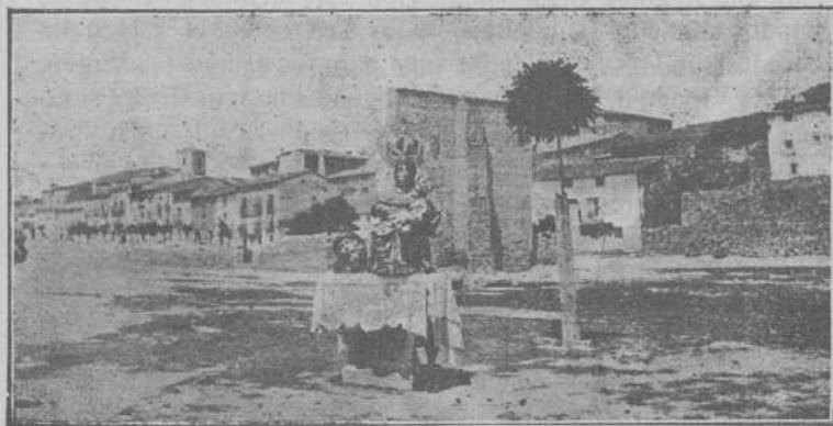
Plaza del Mercado de San Pedro Manrique, donde se celebró la Misa de campaña La Virgen de la Peña y cabeza del Santo Eccehomo.