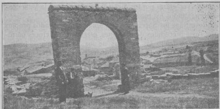
Vista general de San Pedro Manrique desde San Miguel

Fra el día 28 de mayo, del año 1922, una pertinaz sequía agostaba los campos, y el clamor unánime, de los habitantes de Villa y tierra, se expresaban en estas palabras: «Por qué no se pone en novena a N. S. de la Peña.»