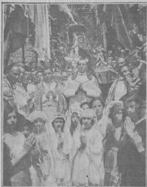
La Virgen entrando en el Templo de la Peña

La fotografía, debida al Sr. Maestro, de Palacio de San Pedro, D. Emilio, da una idea de la llegada de la Virgen al atrio del templo.