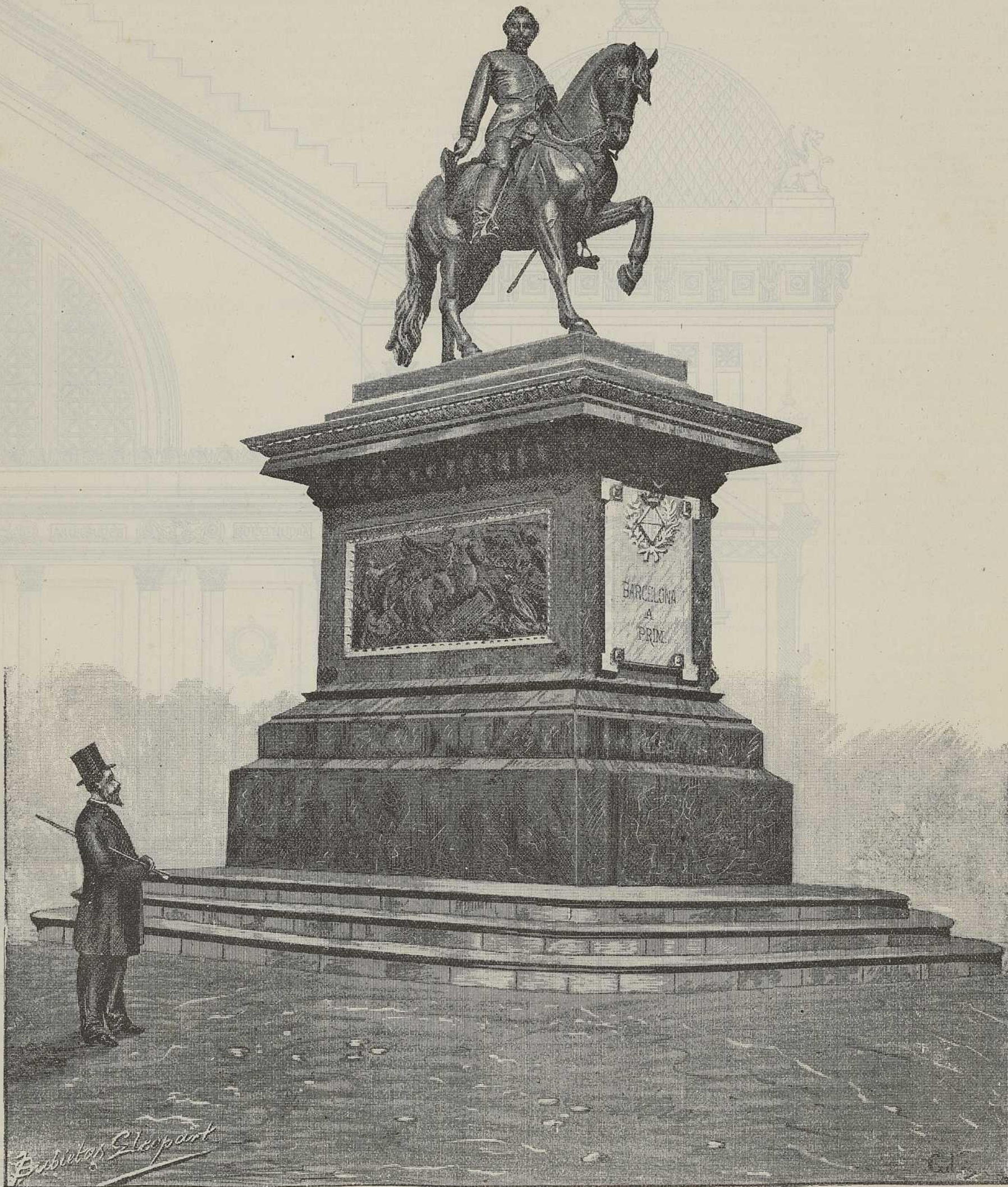
MONUMENTO A LA MEMORIA DEL ILUSTRE GENERAL PRIM, EN EL PARQUE DE BARCELONA