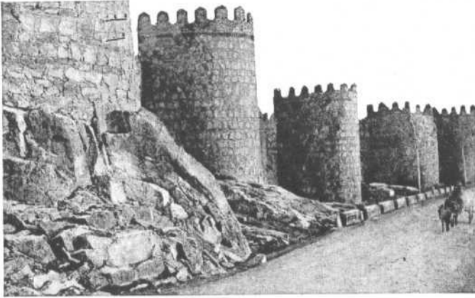
Las murallas de Avila, rosario que circunda la ciudad de los Santos