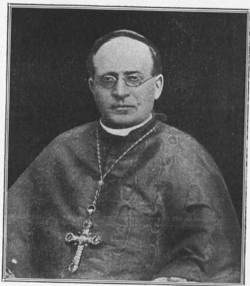
SU SANTIDAD EL PAPA PÍO XI a quien Dios guarde y prospere para bien del Orbe católico