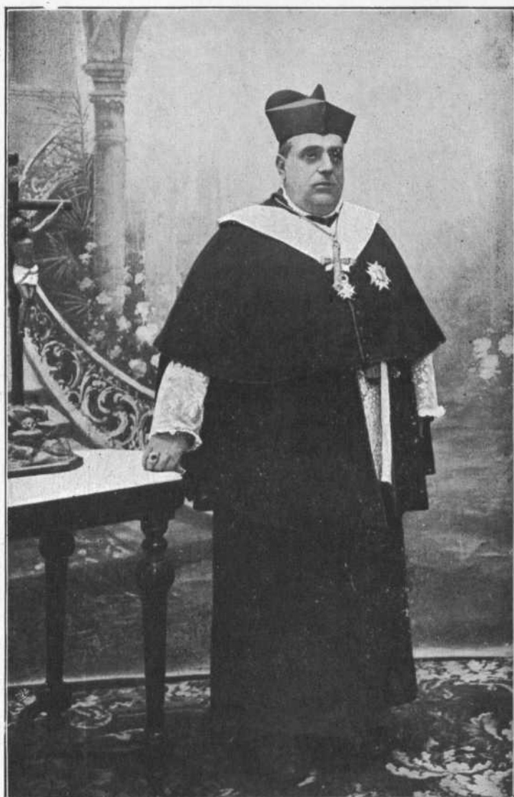
NUESTRO INSIGNE PAISANO EL CARDENAL ALMARAZ que entregó su alma a Dios en Madrid el mismo día que falleció Su Santidad