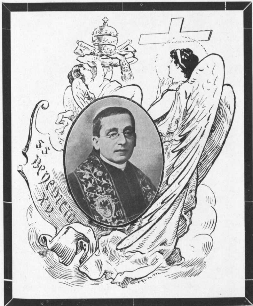
NUESTRO SANTÍSIMO PADRE BENEDICTO XV fallecido en Roma el 22 de Enero de 1922