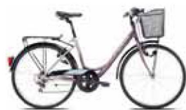
■ Bicicleta de paseo: Orbea Strada Alu 10