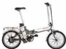
■ Bicicleta eléctrica: Monty Folding "18" Electric.