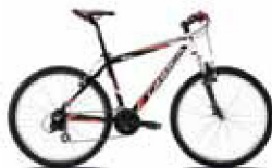
■ Bicicleta de montaña: Orbea Tuareg