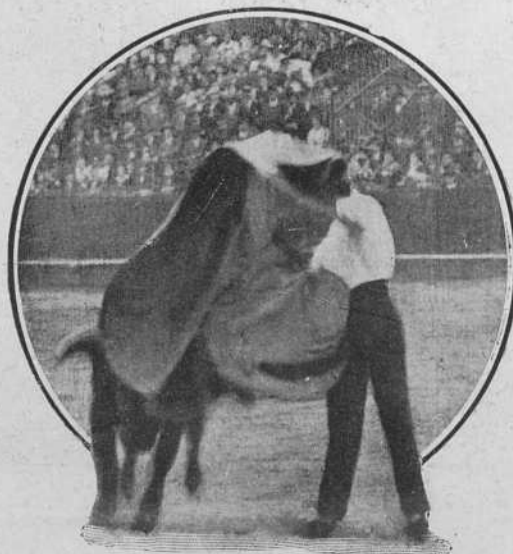
Belmonte toreando por verónicas.

Desflorando los olvidados secretos de la Mari-Clío del toreo en lo que hace referencia á la importancia de este lidiador á caballo, apellidado picador; al galeno taurófilo emborronador de cuartillas, imposible sería seguir sin refrescar un instante, glosando aunque á la ligera á aquellos fenómenos, casos prodigiosos, como queráis llamarlos; héroes de la puya, Centauros del Castoreño , Napoleones del toreo á caballo , que tuvieron por nombre, Sevilla, Pinto, Poquito-Pan, Charpa, los Calderones, Badila, Agujetas , etc.; caballistas an-