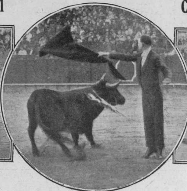
Campitos pasando de muleta.

Especialidad en ampliaciones y retoques de fotografías.