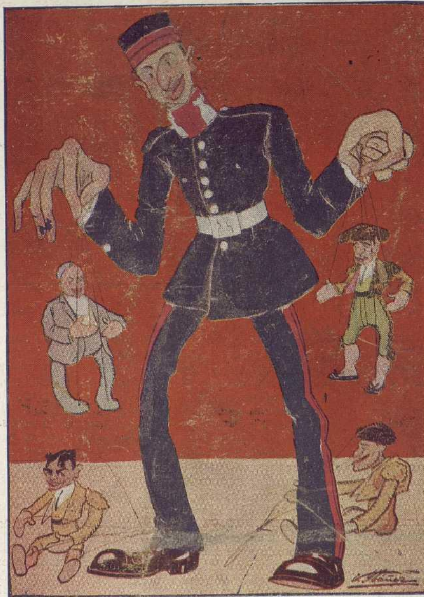
EL MAESE PEDRO DEL RETABLO TAURINO

lo que pensamos y vemos, y no hablando por cuenta de otro, cosa frecuente. ¿No habéis visto alguna vez por cafés y demás mentideros taurinos á estos señores—por regla general, orondos—presumir de entendidos, haciendo alarde de falsa erudición taurómica retrospectiva?, y os diréis: ¿con qué fin pretenderán poner cátedra estos señores de cosas que no vienen al caso y que tal vez no han visto? Pues nada más que para blasonar que entienden de toros.