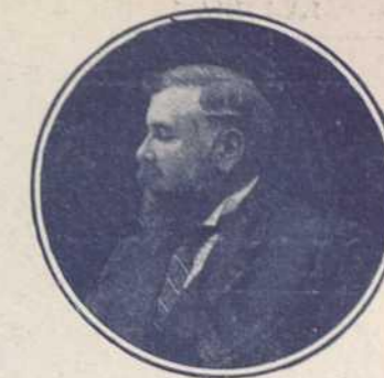
EL HIJO DE DON JOSÉ PALHA

“Comisario” (de la cruce de Veragua) de la ganadería de Palha, lidiado en la Plaza de Vista Alegre (Carabanchel), que por su bravura, poder y nobleza le valió una justa ovación durante el arrastre, después de haber sido muerto de un magnífico volapié, ejecutado por el buen novillero mejicano, Rodolfo Rodarte.