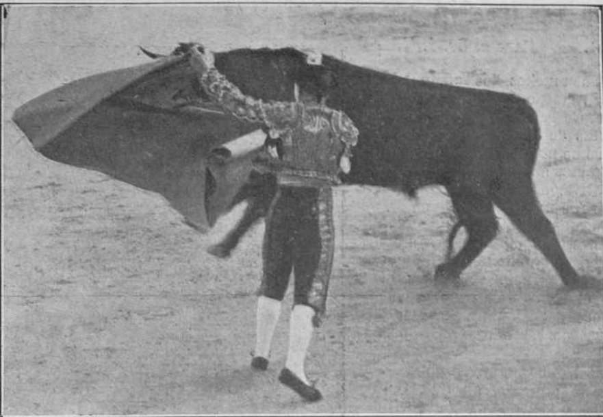
Ale toreando por verónicas.