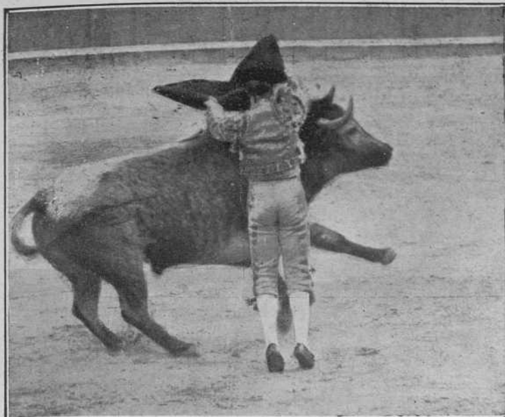
Manolete pasando de muleta.