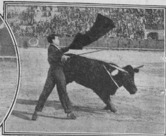
Un pase de pecho de Blanquito.

te todo, concedores como el primero del toro y del toreo, picaban seis toros con el mismo caballo, midiendo contadas veces el suelo, y si levantaran la cabeza y vieran cómo se asesinan actualmente los solípedos, con esas puyas alanzadas y de palo fino para que no se encallezcan las manos de epidermis satinada (?) del Centauro actual, pues los hombres de muñecas de hierro y manos callosas, fueron, se volverían á sus lechos de piedra , avergonzados ante sus herederos. No es de extrañar que fueran los menos castigados en este sport taurino y, por lo tanto, los que menos falta les hacía el cuarto del hule . Para mengua de los herederos de aquellos Centauros y descrédito de la fiesta nacional en la actualidad, la suerte de varas está en decadencia, ha dado el salto atrás que la ha convertido de la más hermosa, viril y vistosa suerte del toreo en espectáculo poco menos que macabro y repugnante arsenal inagotable de traumatizados, y liquidación de la raza caballar.