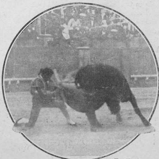
Media verónica de rodillas del niño portento Eladio Amorós