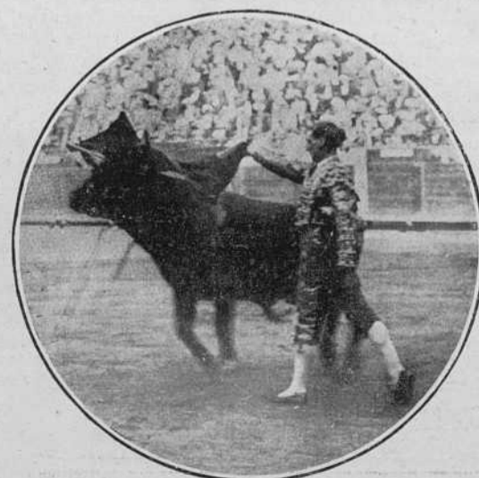
Malla el 30 en Barcelona.