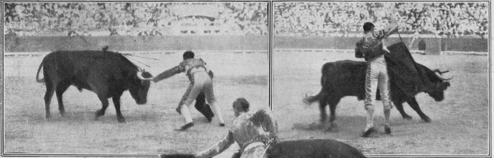
Gallito en la tercera corrida.