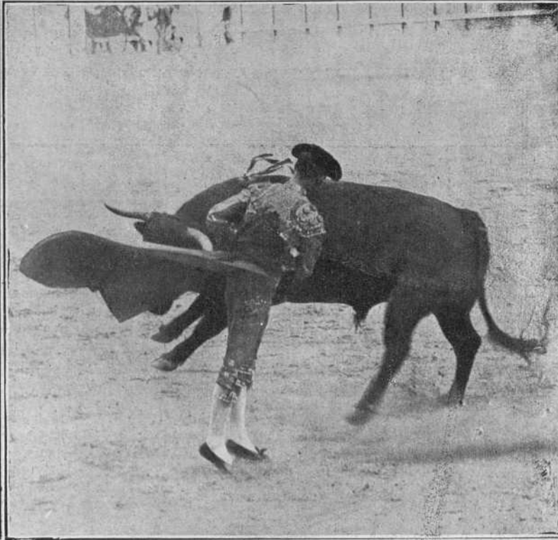
Amuedo ayer en Madrid.