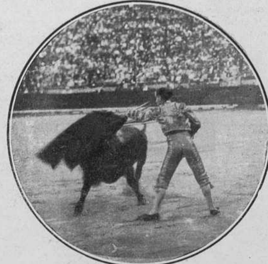
Pastor en la tercera corrida.