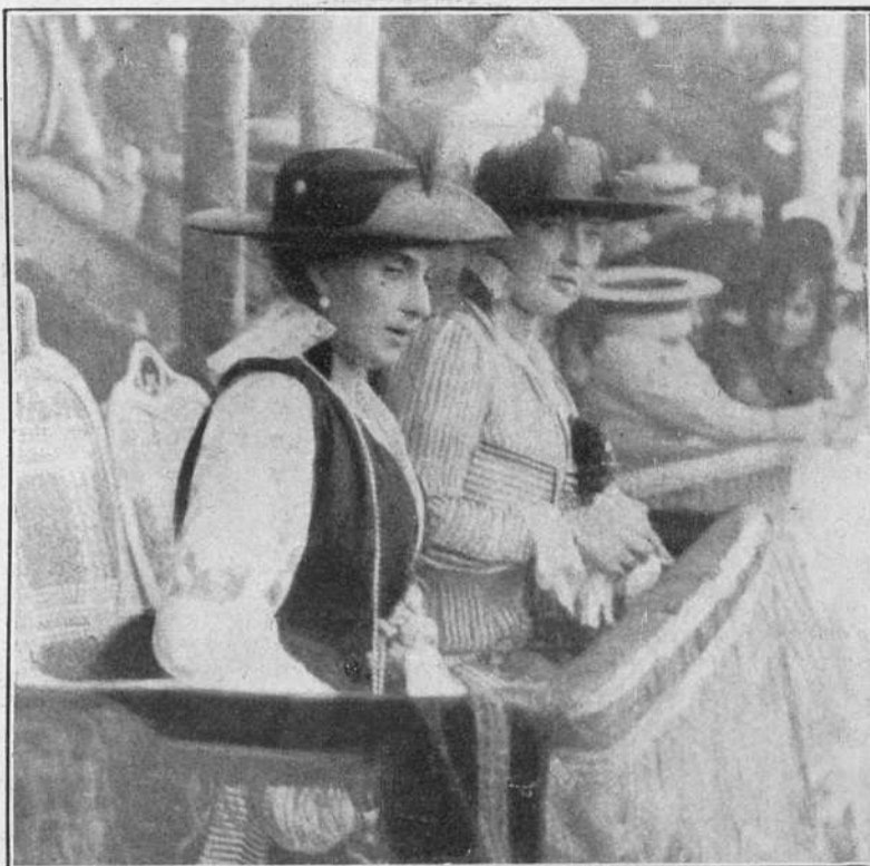
Su Majestad la reina Victoria y la princesa Luisa, presenciando desde el palco regio la corrida celebrada el 30 en Santander.

De cuantas fotografías se nos remitan de corridas verificadas en las plazas de la península se abonarán solamente las que se publiquen.