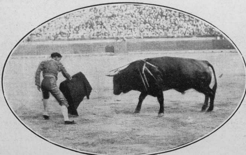
Gaona en la quinta corrida de feria en Valencia.

Los toreros grotescos siguen sin gustarme, pues me parece que el peor enemigo de las corridas de toros no conseguiría inventar cosa mejor que lo que hacen dichos bufos para poner en ridículo nuestra hermosa fiesta.