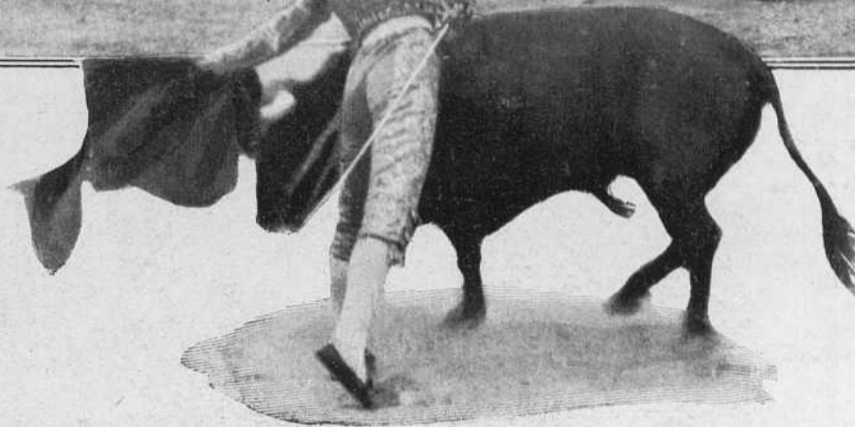
Gallito en la segunda corrida de feria en Valencia.