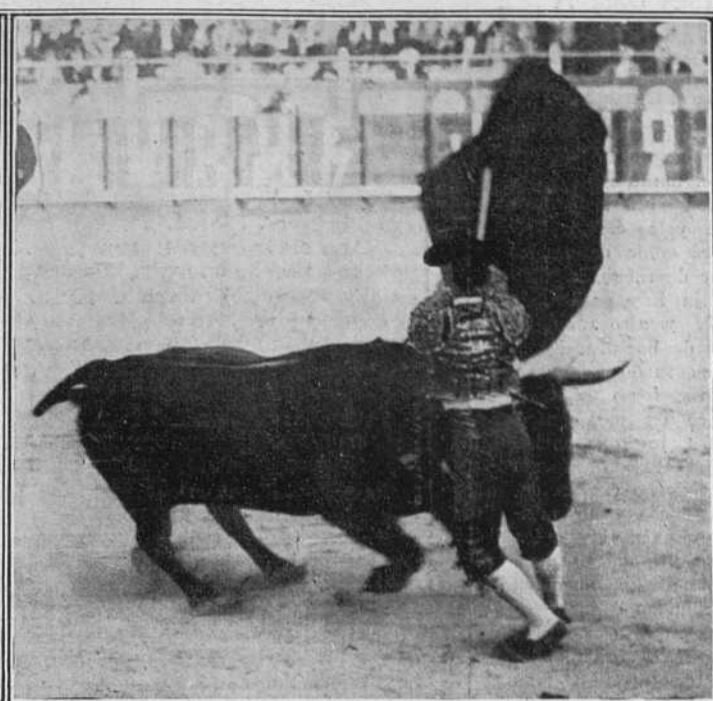
Boli ayer en Vista Alegre.