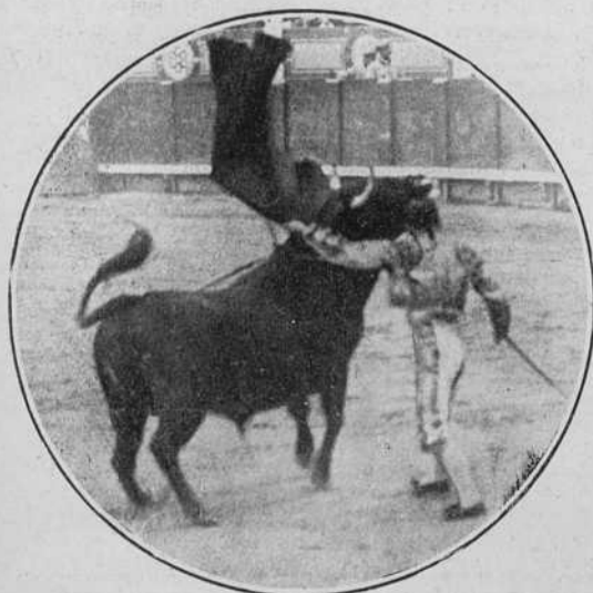
Ale ayer en Madrid.

Que agote la edición es cuanto deseamos.