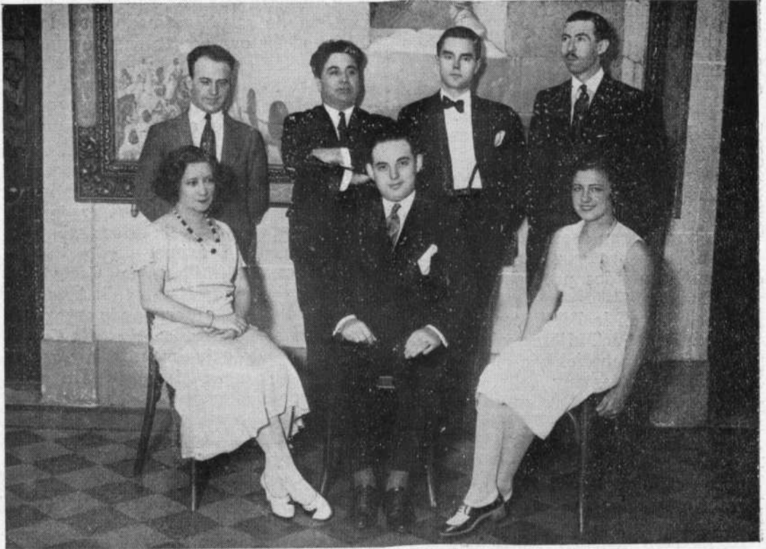
Cuerpo docente de nuestra Escuela de Música y Declamación

Su actuación es eficaz no solo como maestro, sino como concertista y compositor. Entre sus composiciones