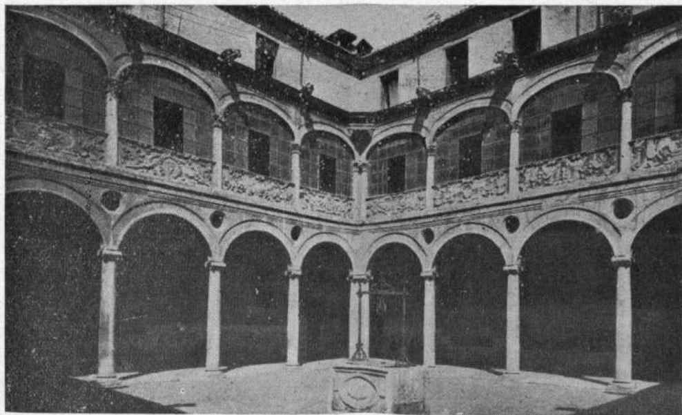
Patio de la Diputación Provincial. — León.

Depósito al por mayor: U. T. 23 Buen Orden 1503