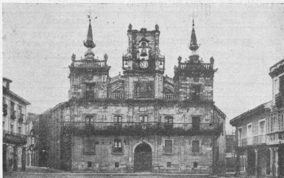
Ayuntamiento — Astorga (León).

Recordamos a nuestros con- socios que pueden inscribirse e inscribir a sus hijos en nues- tra Escuela Gratuita de Mú- sica y Declamación. --- Las clases empiezan el 18 de Abril.