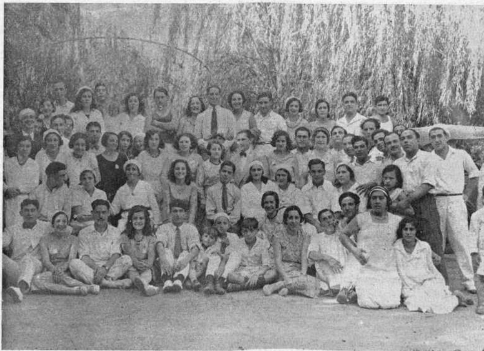
Detalle de nuestra fiesta campestre del 20 de Marzo.

Una vez entregados los premios a los ganadores de las diversas pruebas, que fueron muy aplaudidos por