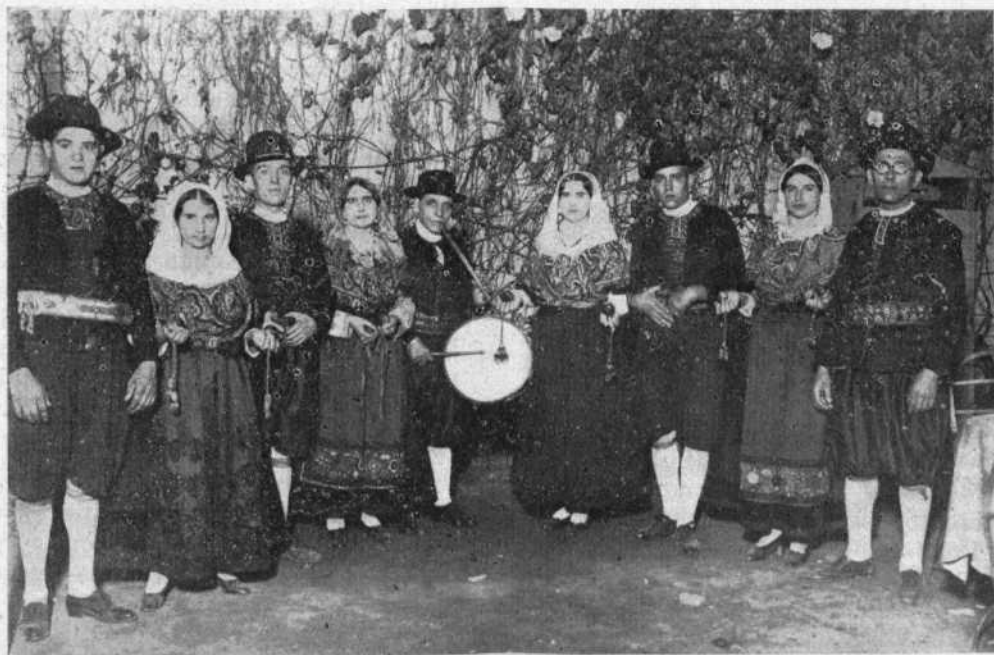
Cuadro regional presentado por nuestro Centro en la fiesta ofrecida a los marinos del buque escuela español

El baile continuó sin decaer el entusiasmo hasta las 4 1/2, siendo obsequiados por la Junta Directiva, en uno de los intervalos, los marineros y clases concurrentes que, en número muy próximo a un centenar, pusieron en nuestra fiesta en su honor, una no-