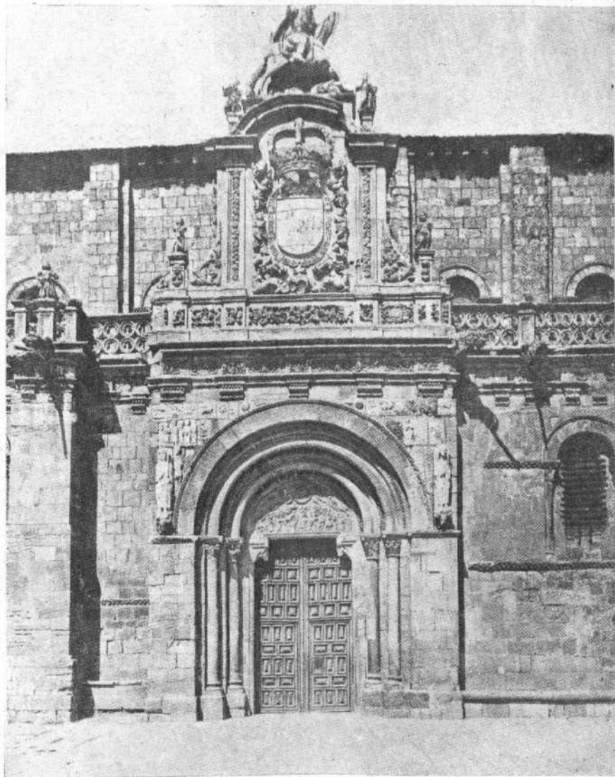
LEON.-SAN ISIDORO. FACHADA PRINCIPAL

Organo Oficial de la Asociación CENTRO REGIÓN LEONESA