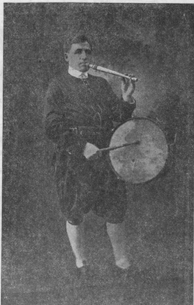
EL DUEÑO (Maragato)

El que quiera comprar unas camisitas, unas camisetas, unos calzoncillos y unas calcetas, bailar una Jota larga o corta, tengo un lindo tamboril y una hermosa flauta, jalza chiquilla que el rodo a rastral que pase por esta su casa el Maestro