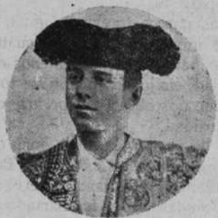
JOSÉ MORENO "LAGARTIJILLO CHICO"