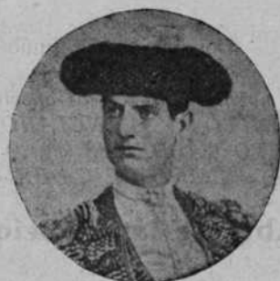
MANUEL RODRIGUEZ "MANOLETE"