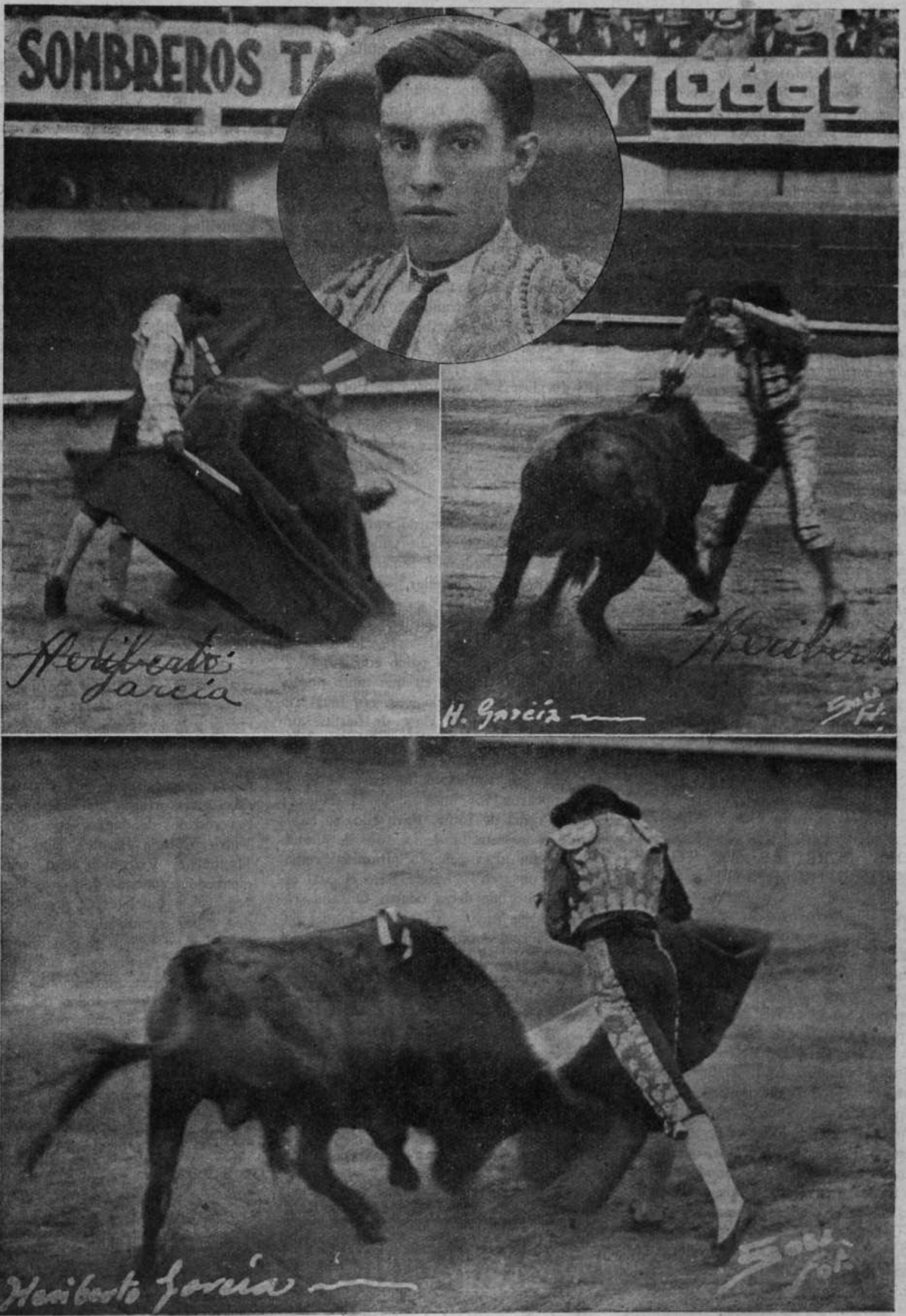
Gran artista mejicano que en su tierra está haciendo una enorme campaña y cuyos constantes triunfos han colocado su nombre entre las grandes figuras del toreo