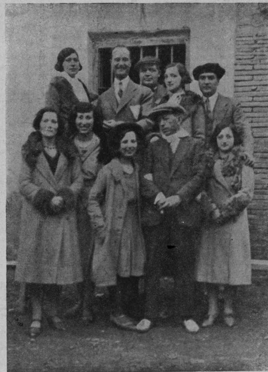
Villalta entre un grupo de bellas fiteranas que se asociaron con entusiasmo al homenaje que las autoridades y el pueblo entero le rindieron agradecidos a su generosidad con los pobres de Fitero

Nicanor Villalta, torero genial y corazón que tiene para ellos el bello gesto de brindarles un poco de bienestar, organizando las