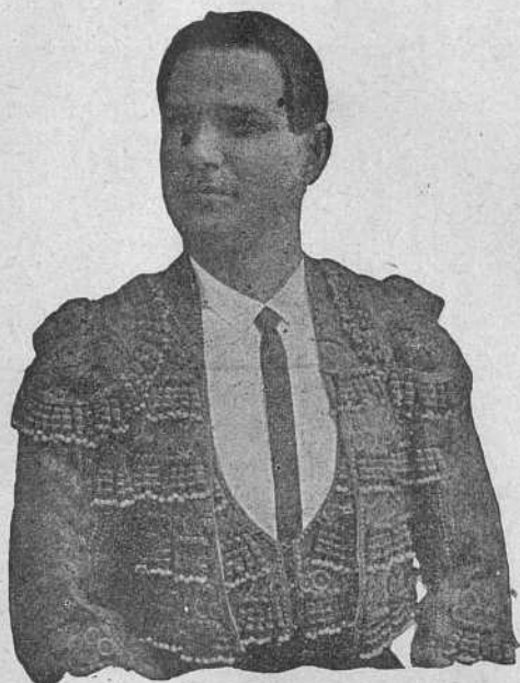
Antonio Moreno (Lagartijillo)

¿Qué resta de aquel Moreno, ahijado del gran Frascuelo, que mataba tan al pelo? Pues, en verdad, nada bueno; ya no pisa su terreno, muletea despegado, y de la recta apartado á la hora de estoquear... No espero verle acabar; para mí, ya ha terminado.