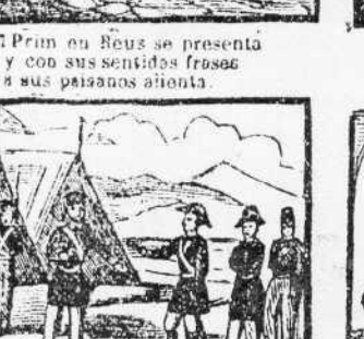
33. Ya de comision a Oriente, y Omer bajo le distingua cual corresponde un valiente.