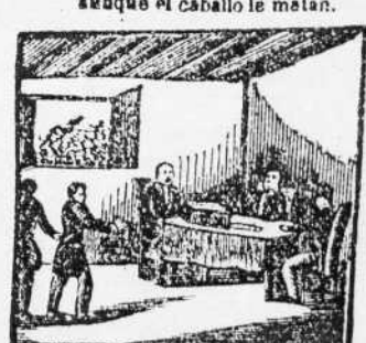
23. A Prim que orayo blasona, por su diputado elige el pueblo de Tarragona.