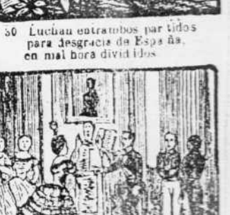
36. Despues que asise engalana con tanto honor, da su mano a una hermosa mejicana.