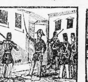
27. Prim en Reus se presenta y con sus sentidos frescos a sus prisioneros alienta.