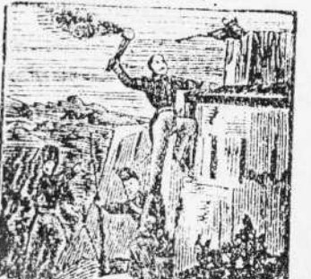
14. Con nuevo honor se corona, pues aunque herido en el hombro contra el primero en Solsons.