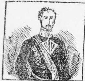
1. Apote el ojo con gloria del general D. JUAN PRIM, la grande y brillante historia.