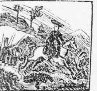
13. El valiente Catalan, pone en completa dorreta al Cabecilla Tristany.