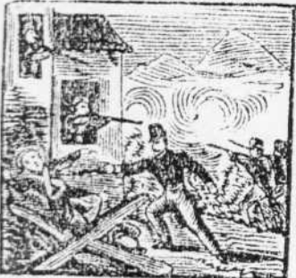
7. De nuevo al Carlista abate, y la echs de S. Ceion, tras un sangriento combate.