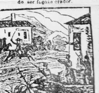
30. Luchan entrambos partidos para desgracia de España, en mal hora divididos.