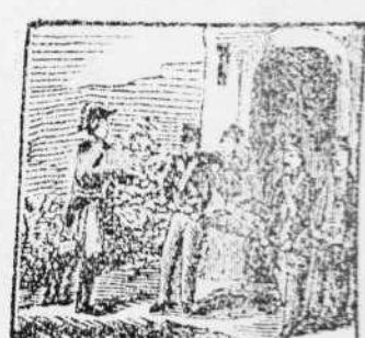
6. Por primera vez herido el grado de subteniente con raxon ha merecido.