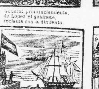
32. Un ministerio imparcial, a la isla de Puerto-Rico le envia de general.