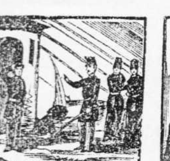
25. En premio de su valor, de fieles Carabineros es declarado Inspector.