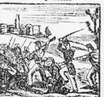
15. En otra sangrienta accion, acudiendo a los libres acuchilla a la faccion.