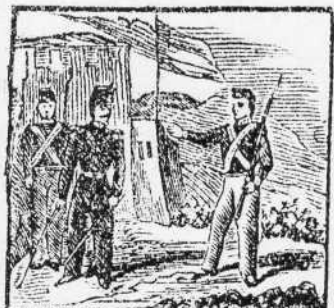
4. Prim el heroe Catalan, entre los libres se alista, a lidiar, con noble afan.