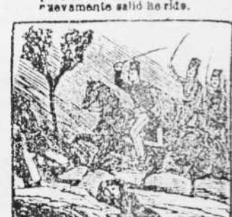
18. De su escolta a la cabeza, dá pruebas mil en Blosca do valor y de firmeza.