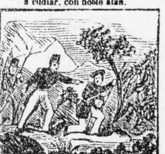
10. Nunca el miedo conoció; y a un faccioso aduanero por si mismo sujetó.