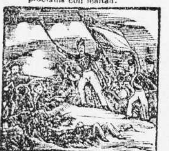
8. Trebolando una bandera, vence a la faccion, que al verlo se arredenta y desespera.