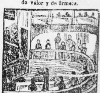
24. A mas de batallador en el Congreso dá pruebas de ser fogoso orador.