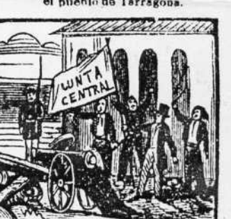
29. El partido liberal se divide y Barcelona el-ma por Junta central.