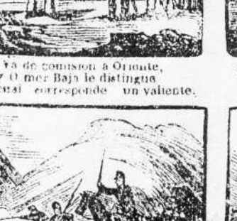
39. Con valiente frenesi llena de oprobio y vergüenza, al osado Marroquí.