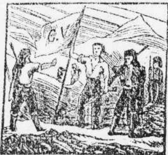
3. Varios mil aconsejados a Carlos quinto desdenden, entre montes y collados.