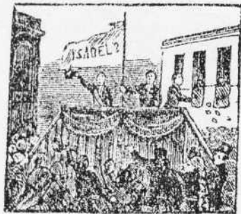
2. Quiera el pueblo libertad, y a n.º Isabel segunda proclama con fealdad.