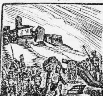
16. Mandando el Baron de Meer, se cubre de eterna gloria Prim, en el sitio de Ager.