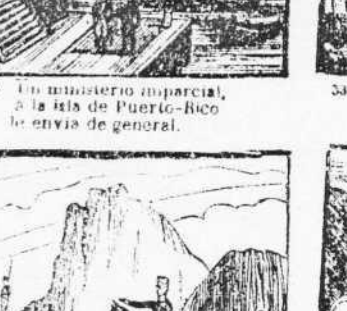
38. Pruebas de gran capitan ha dado, mandando abrir el camino de Tetuan.