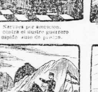
37. Por su indomable teson para ir a lidiar al Africa, lo ha elegido la nacion.