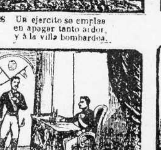
34. El gobierno liberal de Espartero, le da el grado de teniente general.