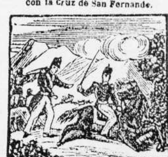
17. En vano vencerle tratan, pues no se inmota en la lucha aunque el caballo le metan.