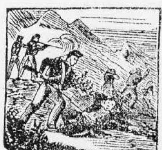
5. Causa de voluntarios, mata a un faccioso y etorra con valor a sus contrarios.