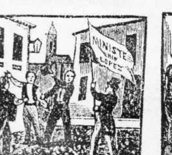
26. General pronunciamento, de Lopez el gabinete, reclama con ardimento.