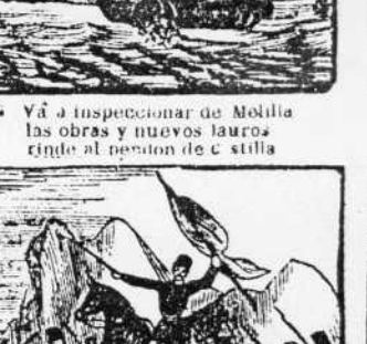
41. Empuñando la bandera al marroco, en Castillejos, amilana y desespera.