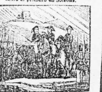
20. El invencible Espartero en los campos de Vergara dá la paz al pueblo liero.