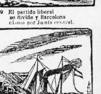
35. Va a inspeccionar de Molilla las obras y nuevos lauros rinde al pension de c stilla.