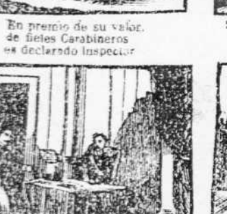
31. Narvaez por amonico, contra el duque guerrero espida auto de pascion.