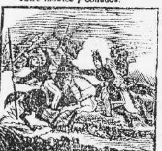
9. En la pelea el primero, acomete cuerpo a cuerpo a un enemigo lancero.