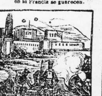
28. Un ejercito se emplea en apagar tanto ardor, y a la villa bombardea.