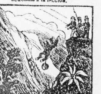
21. En victimas de la saga de sus propios partidarios, el cruel Carlos de España.