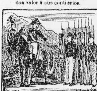
11. Su sluvo valor premiando, su jefe le condecora con la Cruz de San Fernando.