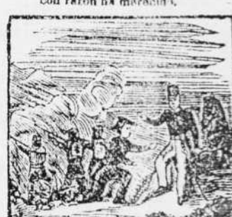
12. Al Carlista ha sorprendido, pero es la dura refriega raxamente salido he rido.