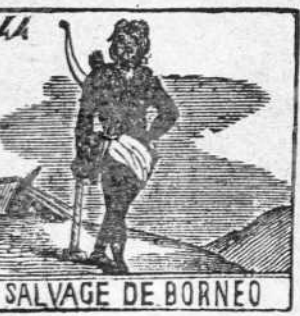
SALVAGE DE BORNEO