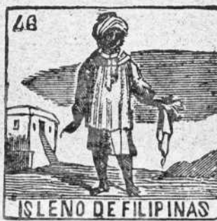
ISLENO DE FILIPINAS