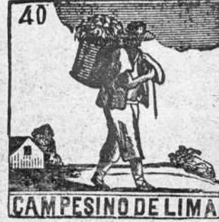
CAMPESINO DE LIMA