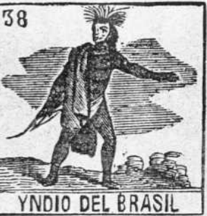
YNDIO DEL BRASIL