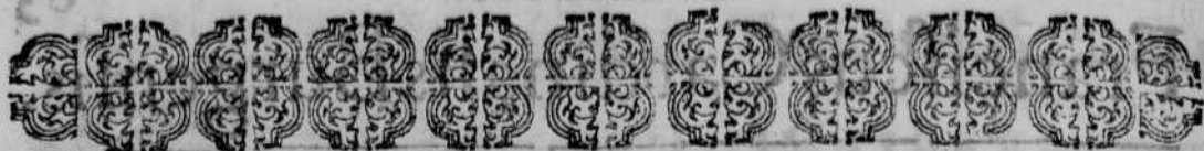
TABLA DE LAS cosas contenidas en estos Estatutos.