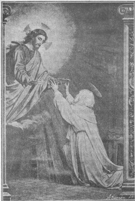
Santa Catalina de Sena, Madre de la Tercera Orden dándole el Señor a elegir entre la corona de flores y la de espinas.