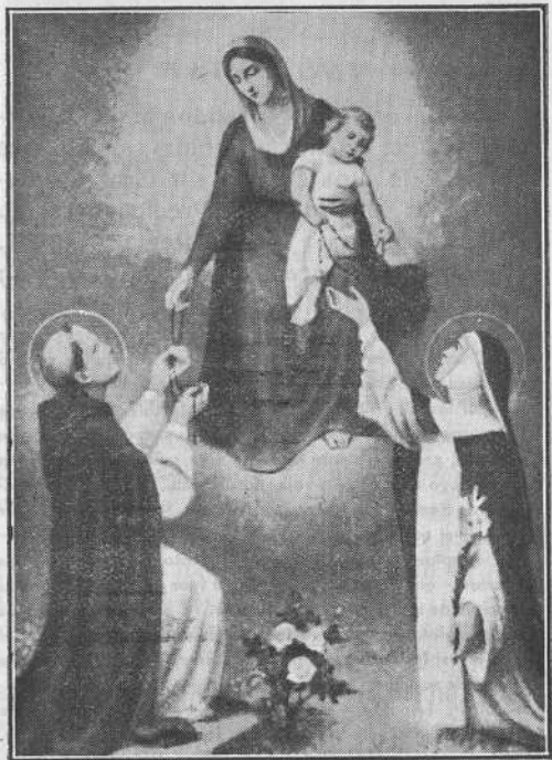
Santo Domingo de Guzmán, fundador de la Orden, re ibe el Rosario de manos de la Virgen.