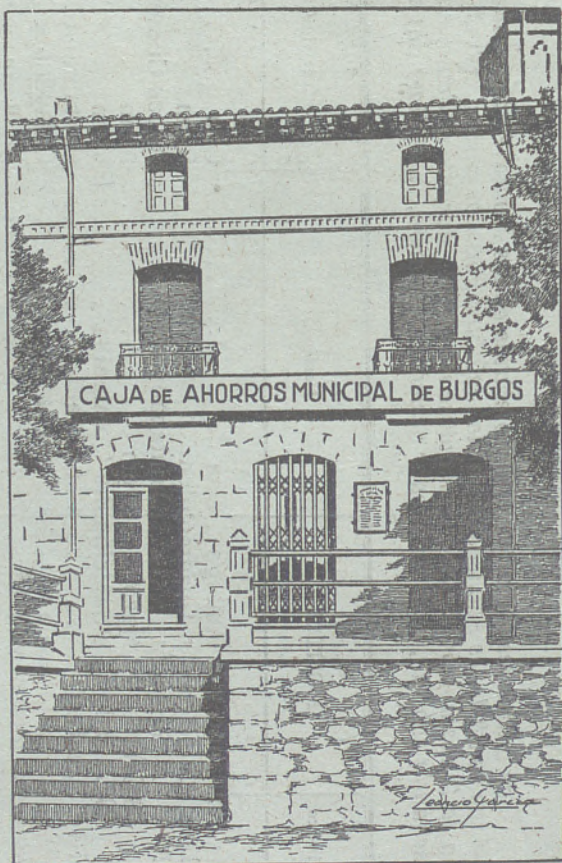
Agencia de la Caja de Ahorros Municipal, en Lerma

Créditos especiales para adquisición de tierras, maquinaria agrícola y mejoras de la agricultura al 3,75% de interés anual