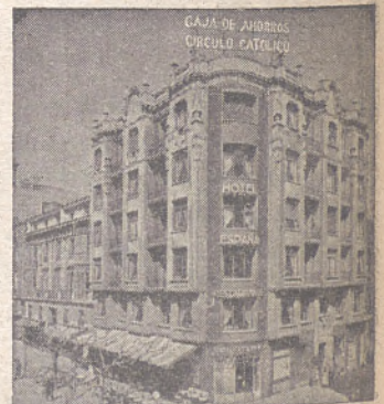
SUCURSAL - Espolón, 32 (ENTRADA POR EL HONDILLO)