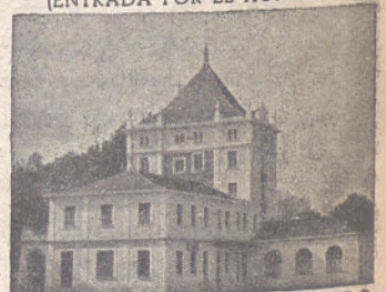
SUCURSAL DEL MERCADO DE GANADOS DE S. AMARO