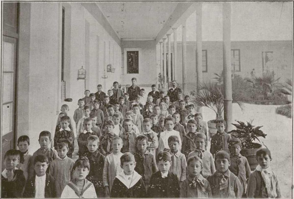
Un colegio de clases graduadas en Bahía Blanca (Rep. Argentina)

Comentario de EDUCACIONISTA. —Cuando aquí en Mallorca nos hallemos tegidos con las nuevas líneas férreas, hoy en construcción y en proyecto, el Turismo tendrá en este país el mejor de sus deleitosos viajes de excursión.