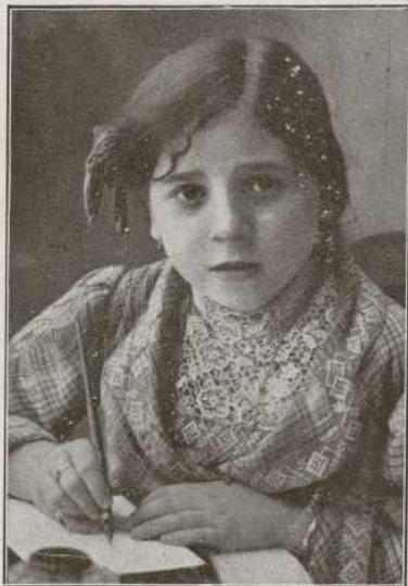
76.—A la que más me agrada.