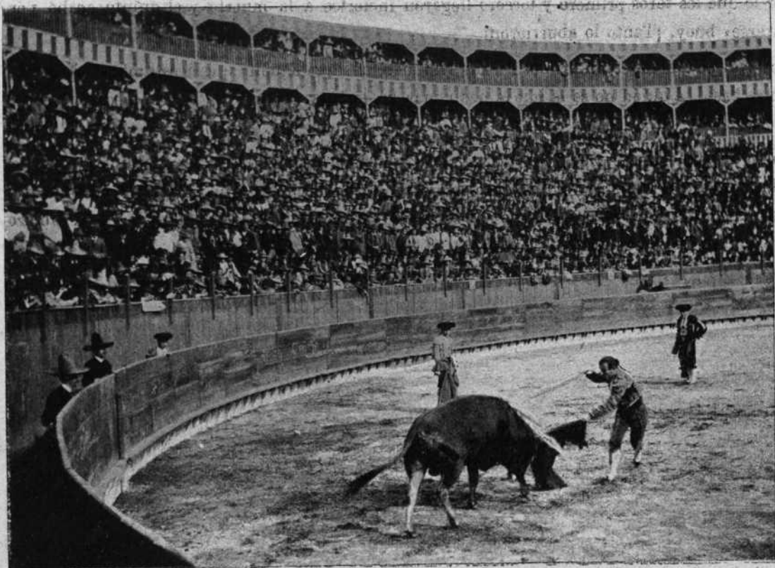
Gorete entrando á matar al toro primero.

En banderillas, exceptuando el tercero que se defendió algo, porque los peones le enseñaron más de lo que aprender debiera, no ofrecieron tampoco grandes dificultades.