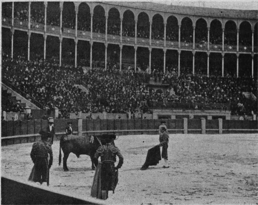
Calerito en el toro segundo.

paso, como Dios quiso, con un par y tres medios, sobrealiando—por lo malos—los que puso Mercurio , que salía de la suerte «marcándose» un paso de jaleo, digno del más afamado bailaor .