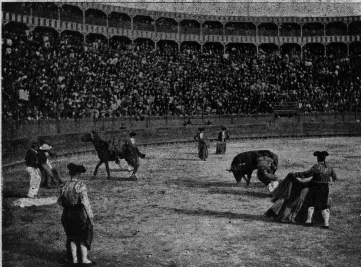
Costa del picador Arriero y Grete coleando al tercer toro

Mucho siento su fracaso, aunque lo creo conveniente para que sirva de ejemplo á muchos