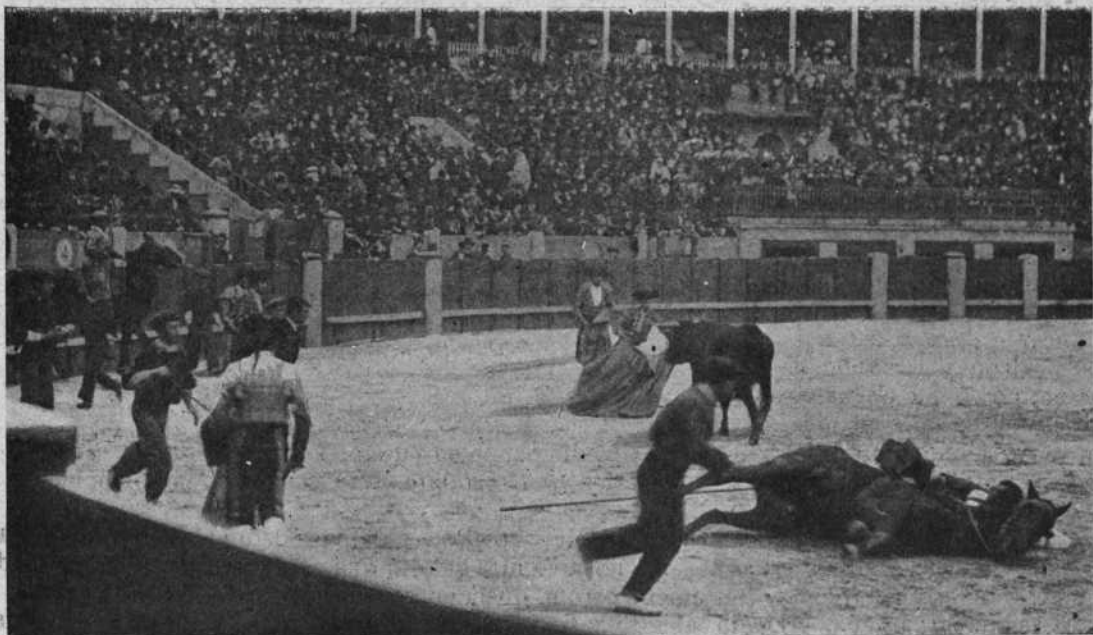
Cantaritos en un quite.

paso, como Dios quiso, con un par y tres medios, sobrealiando—por lo malos—los que puso Mercurio , que salía de la suerte «marcándose» un paso de jaleo, digno del más afamado bailaor .