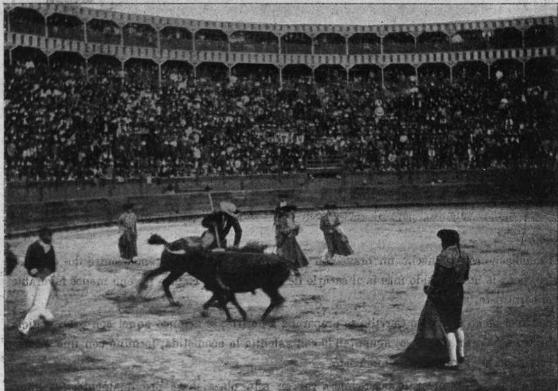
Un puyszo de Arriate al segundo toro.

Respecto al orden de lidia, baste decir que la plaza estuvo «hecha un herradero» toda la tar-