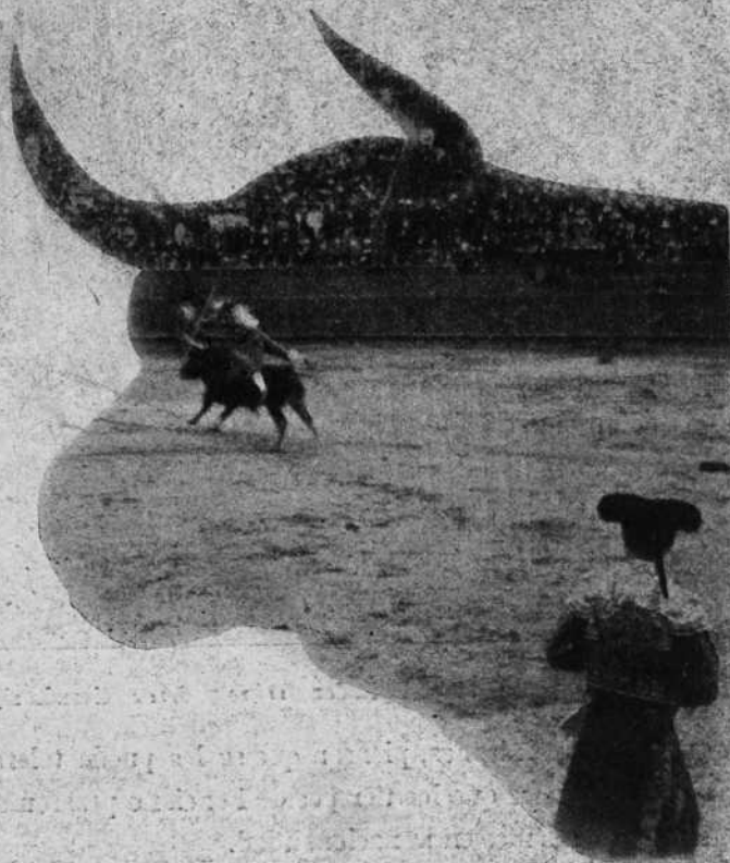
Escijano dando el salto de la garrocha en el tercer toro.

Zayitas , cuando se presentó por primera vez en esta plaza, hará próximamente tres años, toreaba, pero no mataba, ni con cañón de tiro rápido. Hoy, ni torea, ni mata, ni sirve para cosa