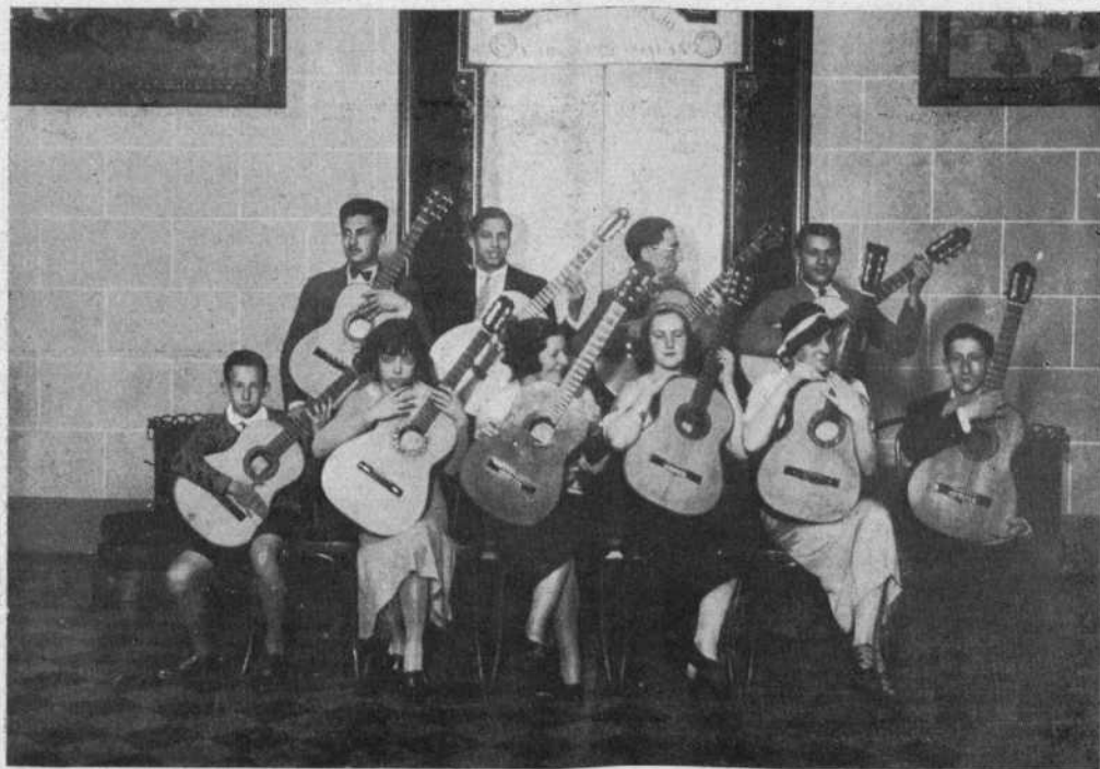
Conjunto de Guitarras