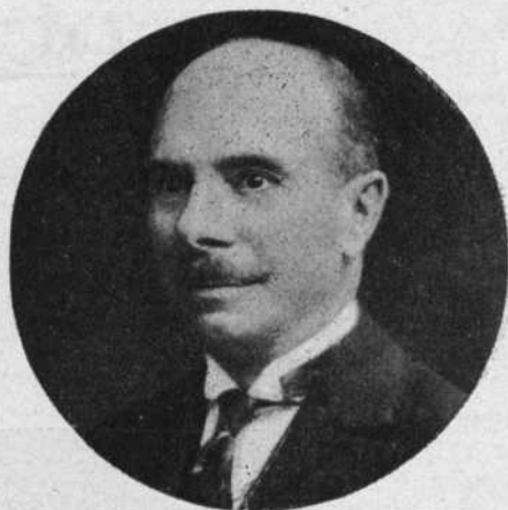
Don. Chevalier Clemente, recientemente fallecido

En el próximo número los publicaremos, juntamente con los de Octubre.