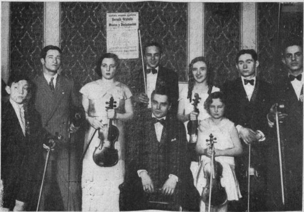
Conjunto de violines