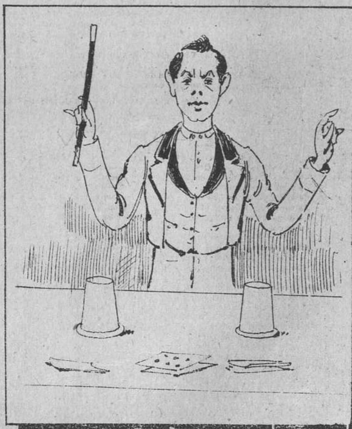
Después, con juegos de mano siguió adelante la fiesta, probando el ejecutante su agilidad y limpieza.