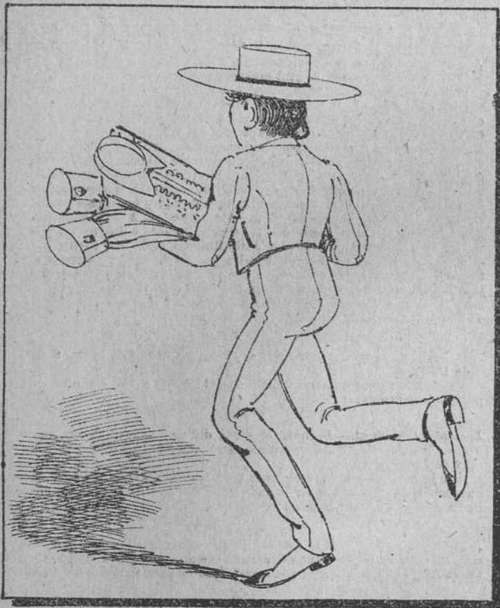
Doy la camisa a este primo, y más de mil la quisieran, que le ofrecerán al punto dos mil quinientas pesetas.