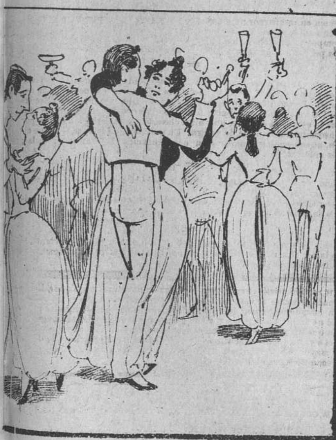
Luego un poquito de baile para la gente soltera, y para la menos joven de Champagne unas botellas.