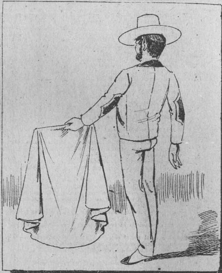
A este joven ganadero le regalo la muleta, para que acudan sus reses con codicia y con nobleza.