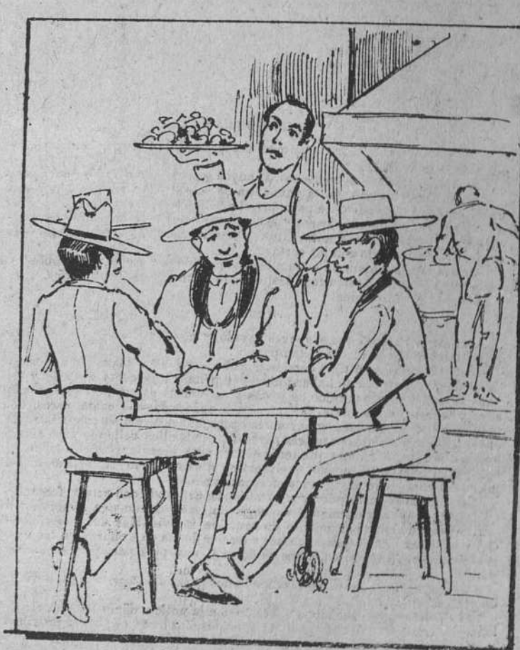
Y por fin unos buñuelos, cuando ya el día clarea, fueron punto a la jornada de tan memorable lancha.