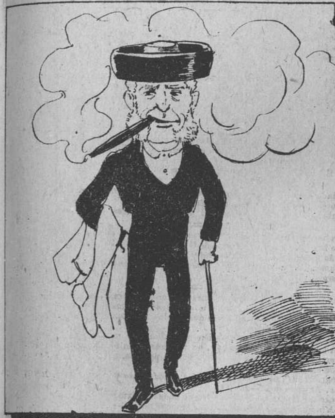
Las medias y zapatillas a esta figura torera, que ya va necesitando un refuercillo en las piernas.