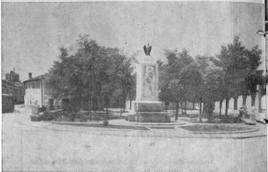
Fuente con motivo ornamental

pio la gracia inestimable de una vida no turbada por el odio o nefandas pasiones. He aquí otra prueba de la señera nobleza que ha dejado la huella espiritual, indeleble, de un modo de ser auténticamente cristiano.