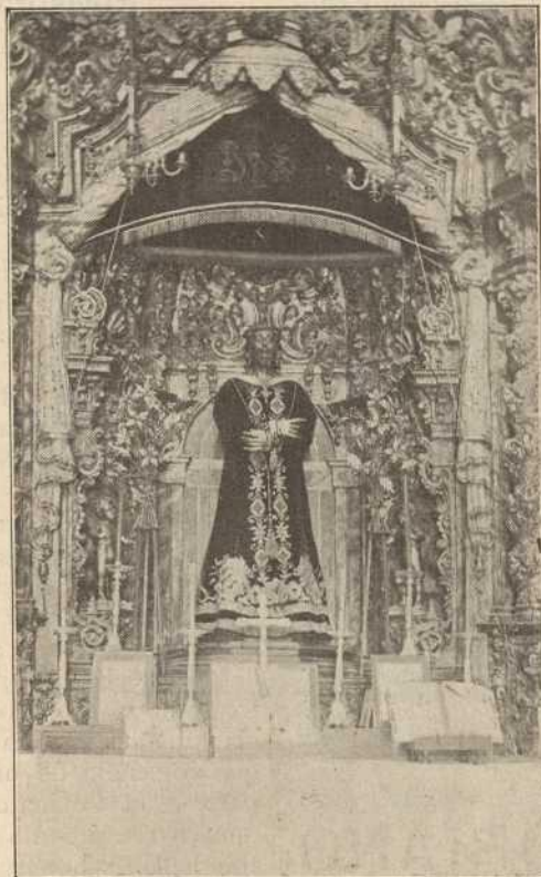
VENERADA IMAGEN DE JESÚS NAZARENO

En sus trabajos como diputado por la provincia de Soria en Cortes Constituyentes, se dió a conocer en toda España, mereciendo plácemes aun de sus mayores adversarios políticos, principalmente del Sr. Argüelles; fué consejero de multitud de generales y árbitro de muchos negocios. Disueltas las Cortes y convocadas otras, el Sr. Tarancón fué nombrado Senador