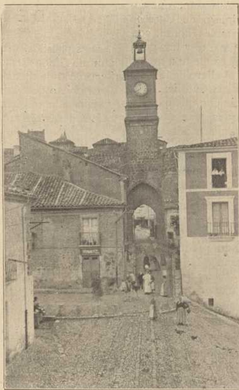
Un bel'o rincón de la villa de Almazán.

Y esta evolución y agrandamiento de Almazán, llevada a cabo con una tenacidad propia, ha venido haciendo de la villa el pueblo rico, el pueblo industrial, el pueblo culto, lleno de esa riqueza natural que invade la mansión laboriosa, justificativa de sus florecientes industrias. Si unimos a esto las bellezas de que la Naturaleza lo revistió, hallamos un horizonte invadido de bellas miras y soñadores paisajes arrullados por el río Duero que besa sus cimientos y sirve de espejo a la hermosa Almazán.