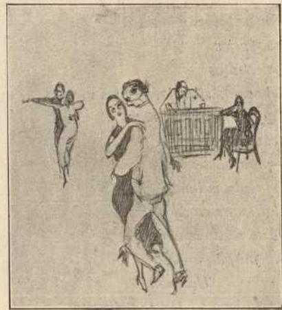
Una noche en «Parisiense», o también Cabruja siente la danza.

—Hombre, recuerdo todas las horas del día a mi hermana; por el mediodía los vermouths