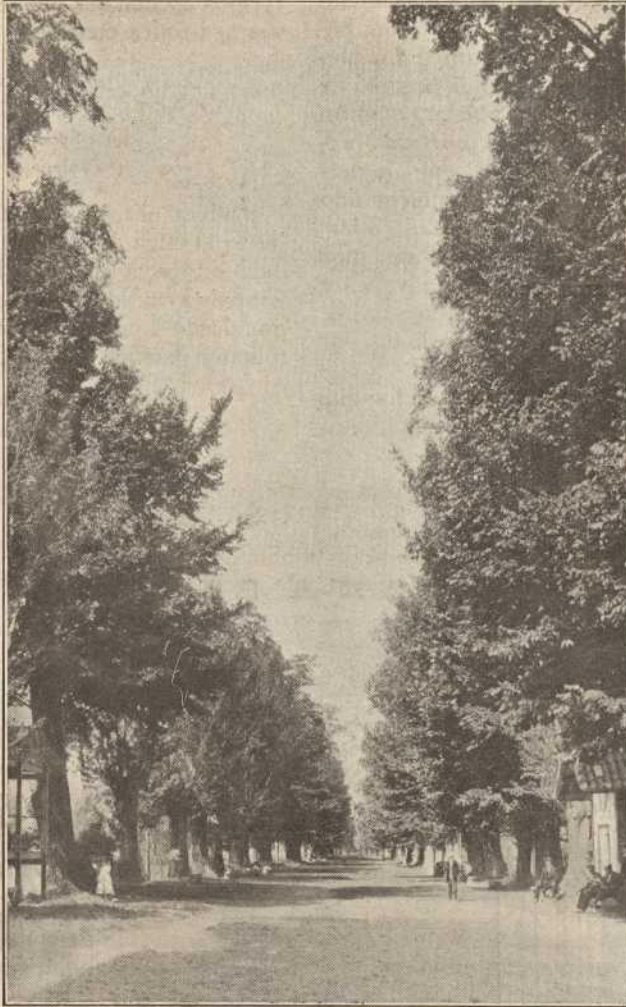
Vista parcial de la hermosa alameda de Almazán.

vías de comunicación, excelente climatología, próximos los saludables pinares y afable trato de tus moradores? ¿Quién no se siente transportado a otras regiones al ver el amor que los adnamantinos profesan a su patrón Jesús Nazareno, rayando en delirio cuando empiezan sus solemnes novenas?