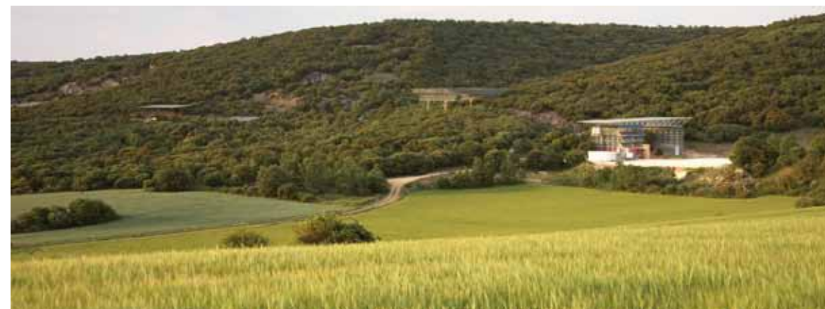
Sierra de Atapuerca. / The Sierra de Atapuerca.