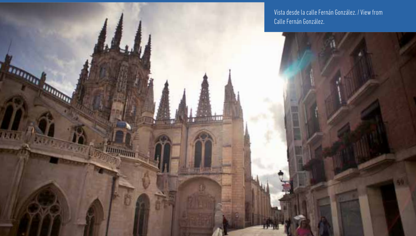
Vista desde la calle Fernán González. / View from Calle Fernán González.

La Catedral exige reposo y anima a ser observada con paz y dedicación para poder disfrutar de su magia y estancias, como algunas de sus 19 capillas y su claustro gótico.