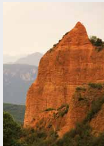
Paisaje característico de Las Médulas. / Typical landscape of Las Médulas.

Unique tangible and intangible assets granted special protection by UNESCO due to the immense scientific and cultural interest generated by their value as natural monuments, urban sites or ancient traditions.