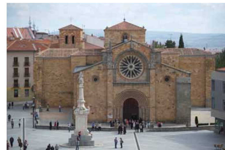
Iglesia de San Pedro y Plaza de Santa Teresa. / The Church of San Pedro and Plaza de Santa Teresa.

Ávila is a welcoming city, well worth a stroll around its alleyways, the district around the Mercado Chico market, and the Paseo del Rastro, while taking in such unrivalled views as those over the Amblés Valley. Ávila also means cuisine: patatas revolconas, judías del Barco, the famed local beef and the delicious confectionery known as Yemas de Santa Teresa.