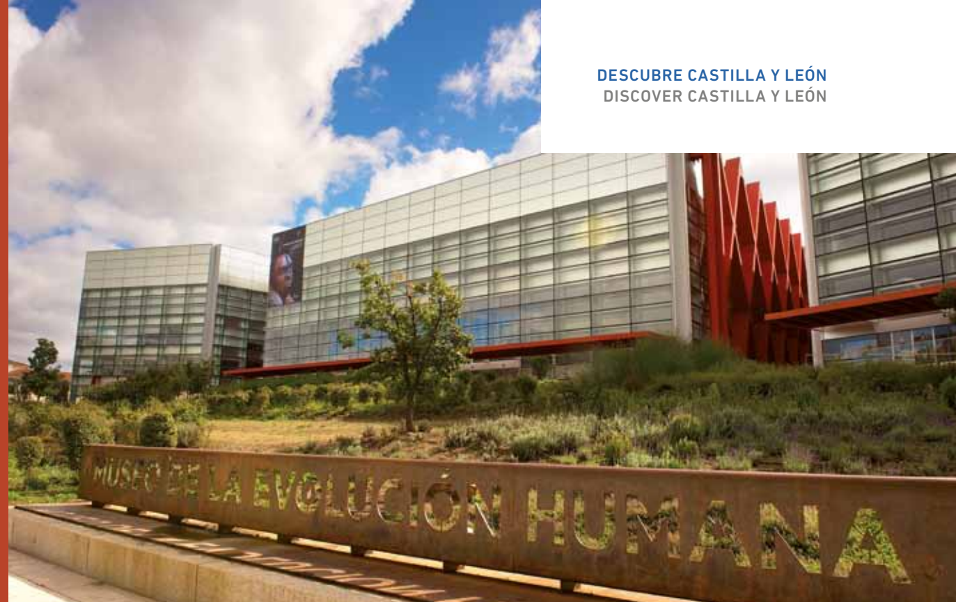
Complejo de la Evolución Humana en Burgos. / Museum of Human Evolution.

Con el objetivo de investigar y divulgar los yacimientos se construye el Complejo de la Evolución Humana en Burgos, formado por el Museo de la Evolución Humana, el Centro Nacional de Investigación sobre la Evolución Humana (CENIEH) y el Auditorio y Palacio de Congresos Fórum Evolución Burgos.