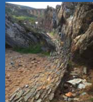
Una de las zonas donde se encuentran los grabados. / Detail of one of the areas where the engravings can be found.

The increase in interest led to the creation of the Archaeology Teaching Centre, dug into the rock itself.