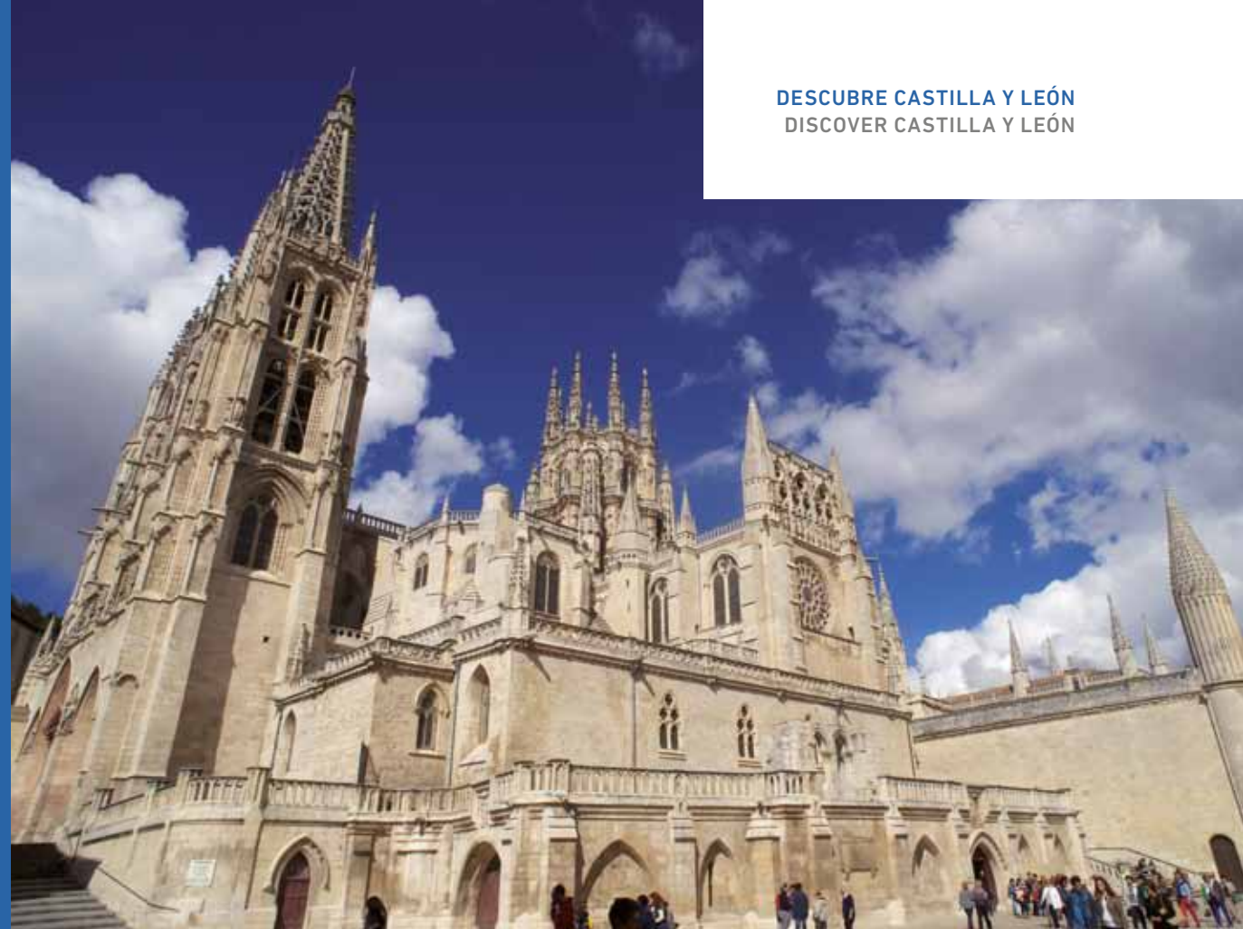
Vista de la plaza del Rey San Fernando. / View from Plaza de Rey San Fernando.

The dome in Burgos Cathedral is an authentic marvel of architecture and sculpture in the Plateresque style, beneath which lies the tomb of El Cid, and his wife, Jimena.