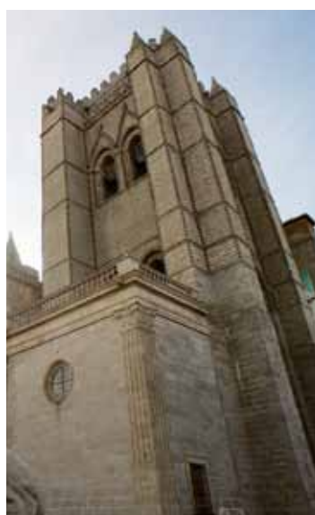
Catedral de El Salvador. Ávila. / Cathedral of El Salvador. Ávila.