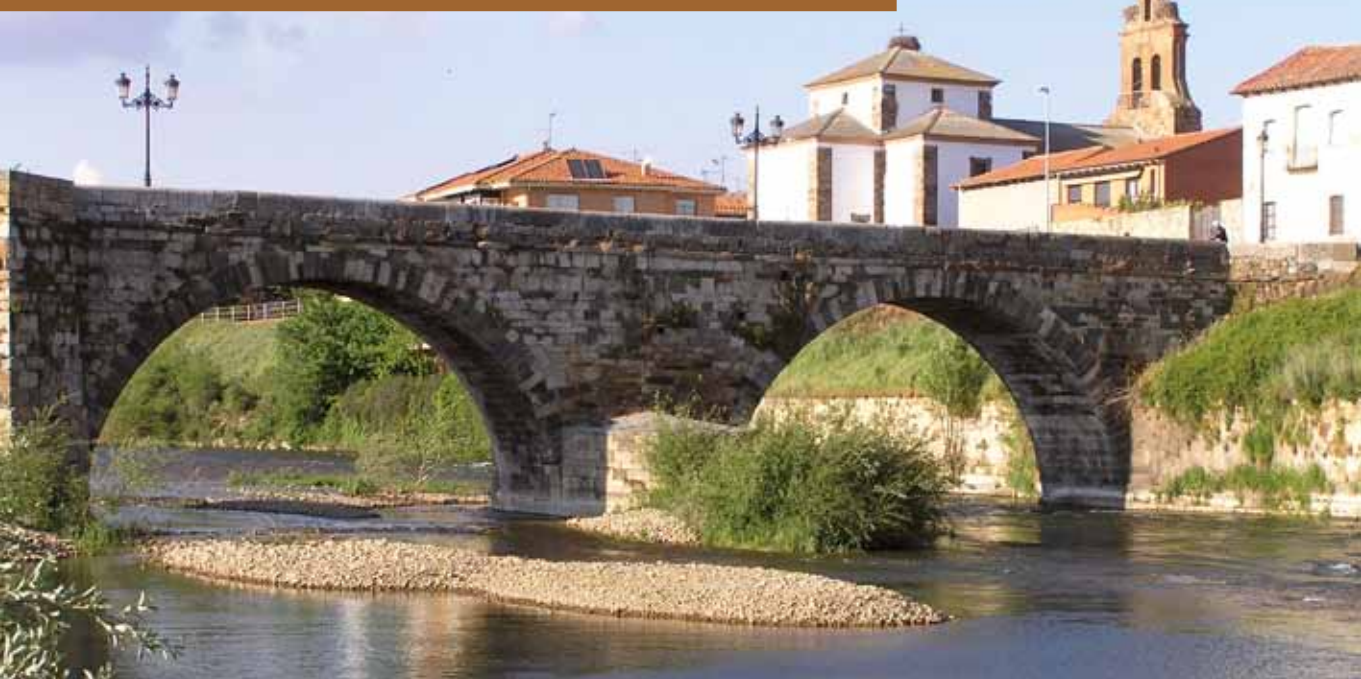
Puente sobre el río Órbigo. Hospital de Órbigo. León. / Bridge over the River Órbigo Hospital de Órbigo (León).

The Pilgrims' Route to Santiago was declared the First European Cultural Itinerary in 1987.