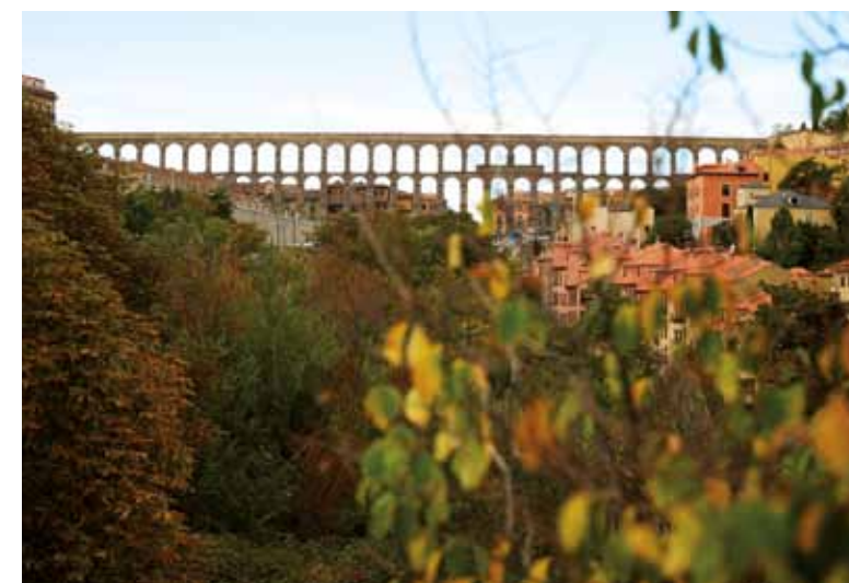
Acueducto de Segovia. / Aqueduct of Segovia.

It measures 15 kilometres in length and 29 m at its highest point. It was built from 20,400 carved blocks of granite, assembled without mortar using an ingenious method to balance the forces. A strength it has maintained for 2,000 years.