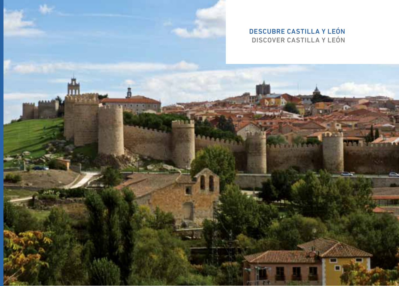
Vista panorámica de la ciudad. / General view of Ávila.