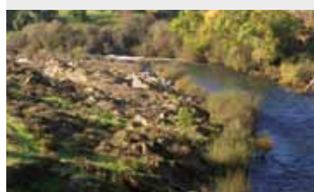
Río Águeda. / River Águeda.

Siega Verde is made up of 95 stone panels running right along the banks of the River Águeda. Their location, as well as erosion, kept them concealed for thousands of years.