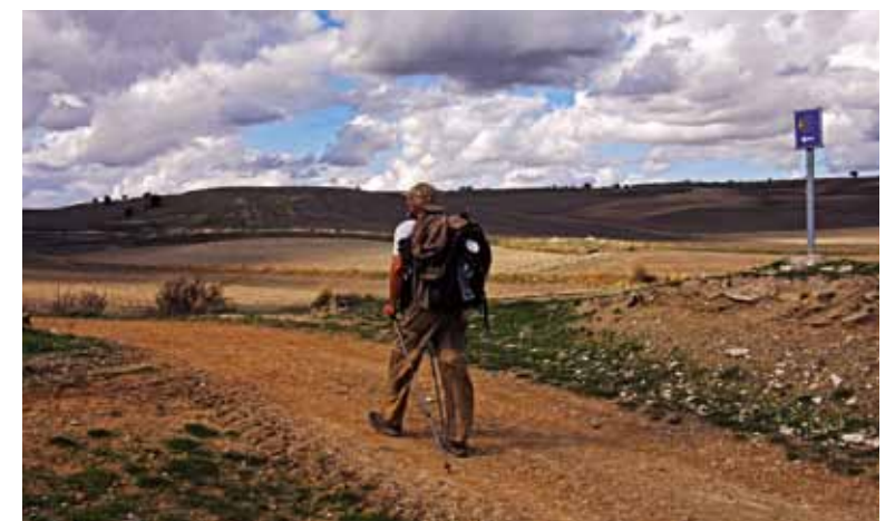
Peregrino haciendo el camino a la altura de la cuesta de Matamulas. Burgos. / Pilgrim making his way up Matamulas hill. Burgos.

The most famous of all the ways crosses through the provinces of Burgos, Valencia and León. 450 km of the total of 750 km long route run through Castilla y León.