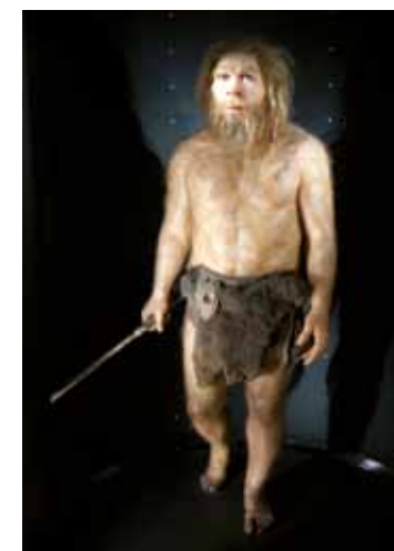
Galería de los Homínidos. Homo rhodesiensis . Museo de la Evolución Humana. / The Hominid Gallery. Homo rhodesiensis . Museum of Human Evolution.

The findings made at the site include particularly valuable and notable specimens, such as the "Miguelón" skull, the "Elvis" pelvis and the "Excalibur" quartzite hand axe.