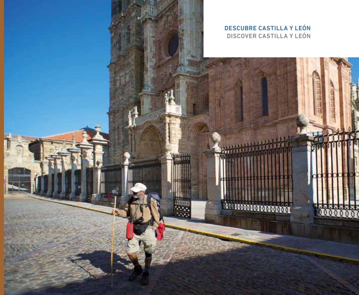
Peregrino en la Catedral de Astorga. León. / Pilgrim at Astorga Cathedral. León.