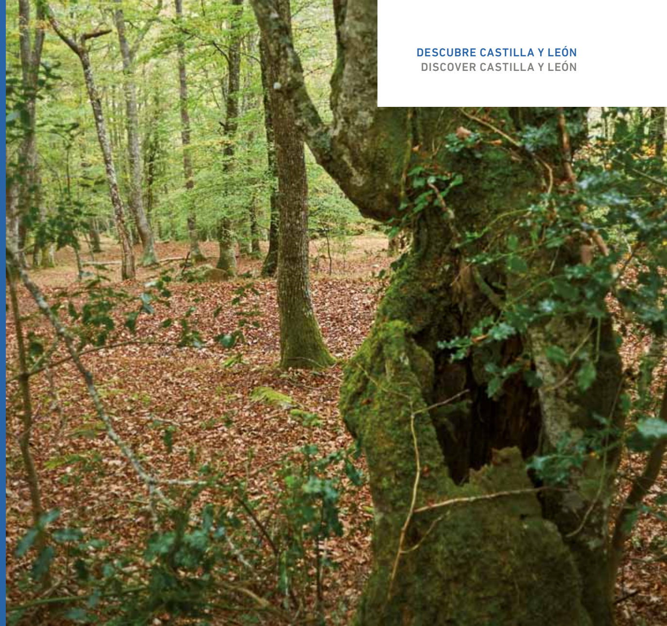
Hayedos milenarios. / Ancient beech woods.

Hayas de hasta 40 metros de altura. / Beech trees rising up to heights of 40 metres.