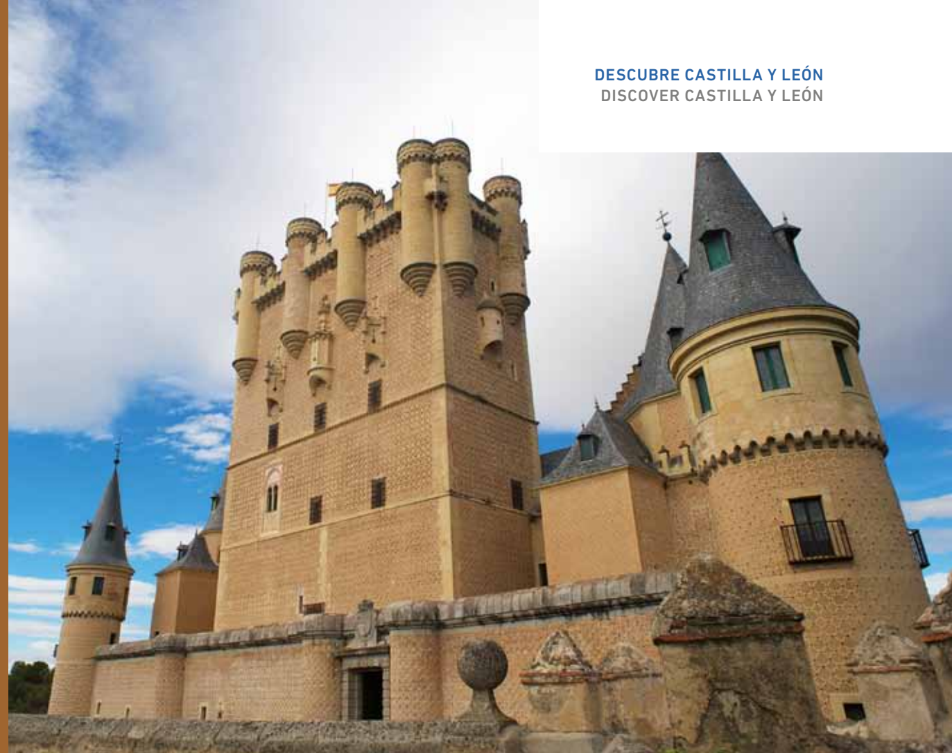
El Alcázar de Segovia. / Segovia Castle.