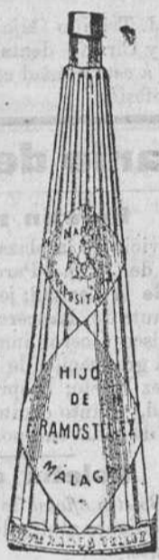
Modelo depositado de la botella de esta casa.