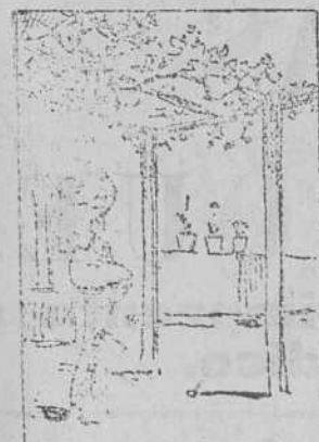
Solución á la charada de ayer: CARACOLADA