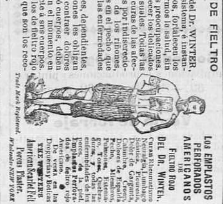
Los emplastos perforados americanos de fieltro rojo del Dr. Winter.