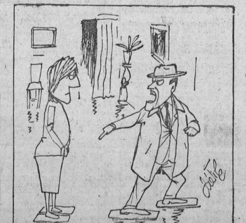
— Si crees que me vas a dominar, estás muy equivocada... ¡Me voy para no volver!

La actividad católica respecto del cine reflejada en cifras podría resumirse en estos datos muy poco alentadores: 99% de palabras, y 1% de realidades. Y quizá, por lo que se refiere a las realidades, la cifra es todavía excesiva. La presencia católica en el mundo de los cursos cinematográficos, de las conferencias, cineforums, artículos de crítica, folletos y libros, es abundante, sobre todo en los últimos años; en cambio, esta misma presencia es insignificante, casi ridícula, en el campo real y primordialmente eficaz de la cinematografía: la producción, la distribución y la exhibición. Pienso que con harta frecuencia se plantea erróneamente la estrategia fundamental del catolicismo para la solución de los graves y apremiantes problemas, que el cine plantea tanto para la fe moral cristiana como para la religiosidad y la ética elemental de la humanidad. Estrategias fáciles y disparadas sus balistas contra los grupos relativamente pequeños, que tienen en sus manos la realización, la distribución y la exhibición cinematográficas. Hasta el presente hay que reconocer que la presión cristiana sobre estos rectores y creadores de la cinematografía mundial es leve y casi ineficaz por su ineficacia. Fortísimas razones explican este fracaso católico en el campo de la cinematografía.