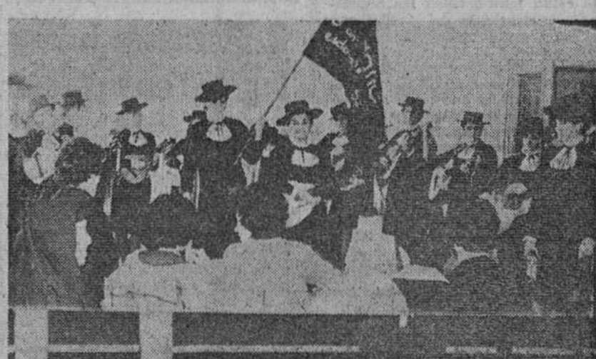
Cádiz.—La «Tuna» femenina del Colegio de las Esclavas, de Bilbao, se encuentra en gira benéfica por Andalucía y con tal motivo, tocadas con sombrero cordobés, ofrecen su arte en los hospitales y centros benéficos de la ciudad.