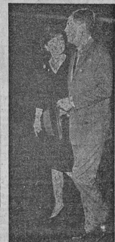
Washington.— Después de su largo viaje por el Oriente y por Europa, la bella esposa del presidente de los Estados Unidos llega a Washington, donde fue recibida por su esposo, el presidente Kennedy.