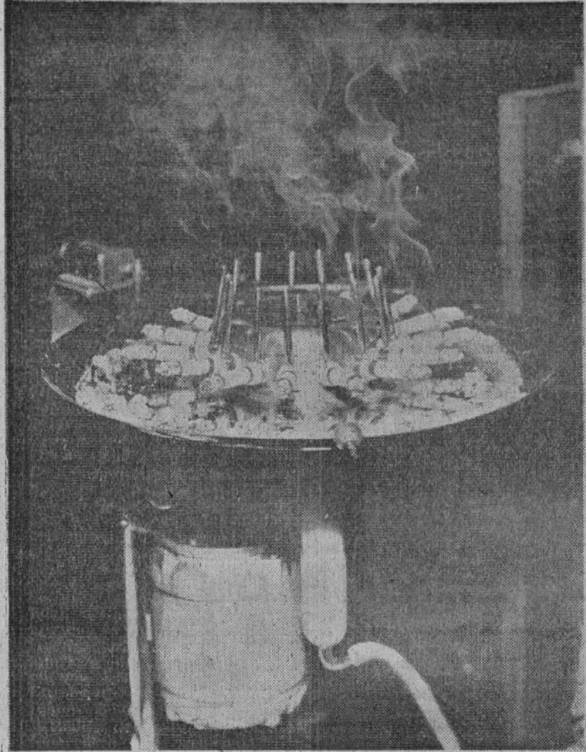
La instalación automática de fumar revela el secreto de cada clase de cigarrillo. Puede descubrirse mediante este aparato la clase de tabaco usada, su contenido en nicotina, la cantidad de tabaco empleada y muchas cosas más. Los estudiantes muestran un interés particular al hacer ensayos con este pulmón artificial.

Hamburgo. (Impresiones de Alemania, especial para DIARIO DE BURGOS). — El consumo de cigarrillos y cigarrillos aumenta de año en año, de modo que la industria correspondiente apenas puede acompañar este ritmo. Ingenieros y especialistas de gran medio que ingresan en la industria de tabacos con conocimientos técnicos generales, ya no están a la altura de responder a todas las exigencias que con la consecuencia del desenvolvimiento rápido, de la racionalización y de la automatización. Este hecho indujo al director de una gran firma hamburguesa que se dedica a la construcción de máquinas para fábricas de cigarrillos, a pensar en la formación de ingenieros especializados en este dominio. Su idea ha sido buena acogida en las fábricas de cigarrillos de Europa y, más tarde, hasta de todo el mundo. Varias fábricas en Finlandia, Suecia, Noruega, Inglaterra, Grecia, Holanda y en otros países sembraron, en colaboración con empresas alemanas, los medios financieros necesarios para la creación de una escuela técnica especializada. El 1.º de Enero de 1956 se fundó en el área de la fábrica de máquinas de cigarrillos, en Hamburgo-Bergedorf, este instituto, único en el género en todo el mundo. El trabajo del instituto comenzó con cursos de capacitación de tres a cuatro meses para "estudiantes" que ya trabajan en la práctica y pretendían completar sus conocimientos. En Abril de 1958, el primer grupo de jóvenes alemanes y extranjeros pudo comenzar el primer curso de tres años.