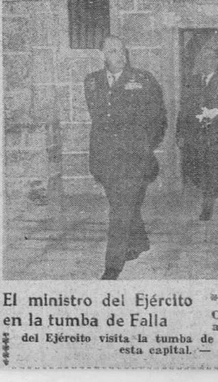
El ministro del Ejército en la tumba de Falla

ROSO DE BOTELLAS DE VINO. Windsor (Inglaterra). — Unas cuantas botellas de vino han sido robadas de un armario en el departamento de la Reina Isabel en el castillo Windsor, según ha informado la policía.