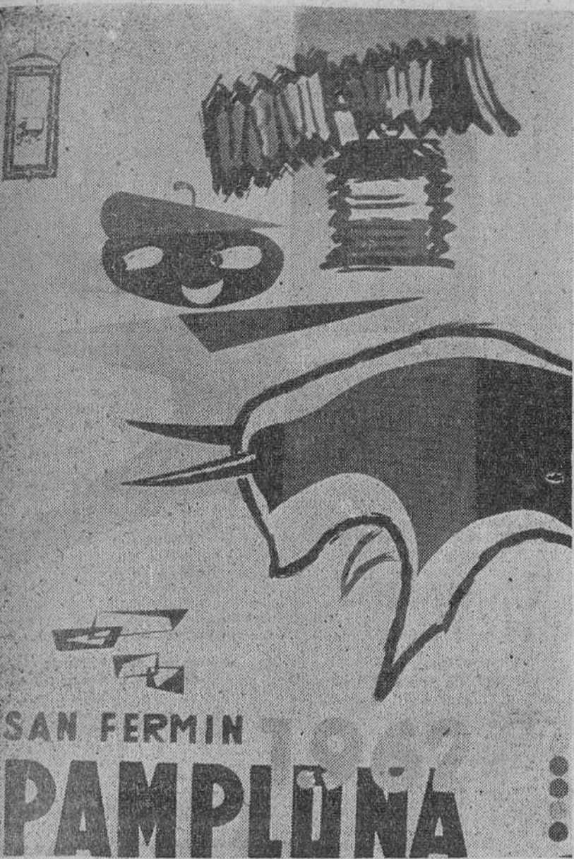
Pamplona.—Cartel premiado en el concurso correspondiente a los "sanfermines" de este año. Fue presentado con el lema "Farolillos y encierro".

A partir del 8 vamos a trasnochar menos. La noticia podrá no ser del todo grata para los noctámbulos que, además de serlo, son unos horradados trabajadores, que, quieran o no, por las mañanas tienen que saltar tempranamente del lecho. Pero, si serenamente lo miran, vendrán a la conclusión de que esto de dormir una o dos horas más, todos los días, les va a venir muy bien, sin que por ello tengan que renunciar a ver películas u obras de teatro. Por otra parte, esto del trasnochar había venido muy a menos, en los últimos años. El número de noctámbulos, de noctámbulos por puro capricho, no era ya el de otra época, mucho más floja para el trabajo que ésta. Lo de que cada cual tenga dos empleos, uno para por la mañana y otro para por la tarde, había enflaquecido mucho el noctambulismo, que se iba quedando, poco a poco, para gentes de paso y sin quehaceres. Estas, con las nuevas disposiciones, podrán seguir en suactividad todo lo que quieran. Pero quien desee ver por la noche una comedia y entregarse por la mañana a su trabajo, no tendrá que erigirse en noctámbulo.