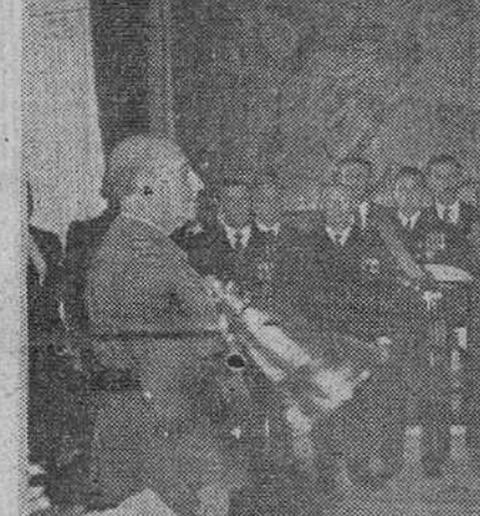
audiencias del Jefe del Estado

CONGRESO SINDICAL. Madrid.—Para los días 5 al 10 del próximo mes de Marzo, el delegado nacional de Sindicatos ha convocado el pleno del congreso sindical. En cumplimiento de las normas que regulan el funcionamiento del Congreso Sindical, éste ha de reunirse anualmente en sesión plenaria para examinar los problemas que se refieren al interés económico, social e institucional de los españoles.