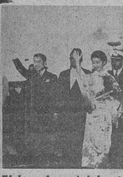
El heredero del Japón en Pakistán

Fukuoka (Japón). — Seis mineros han resultado muertos a consecuencia de una explosión de grisú en una mina de carbón. Trece mineros se encontraban trabajando en la galería en que ocurrió la explosión. Diez resultaron ileso, pero otros tres murieron en el hospital. Otros tres fueron atrapados por el desprendimiento producido por la explosión, muriendo en el acto.—Efe.