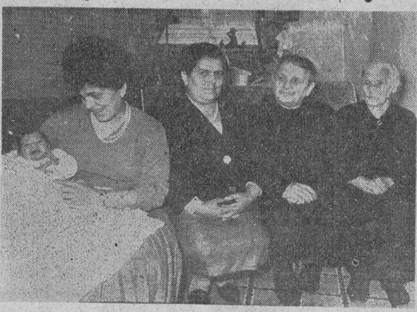
Caon (Cádiz). — Cinco generaciones en esta fotografía. Está familia vive en el número 8 de la calle de la Trinidad. De izquierda a derecha el recién nacido, su madre, la abuela, su bisabuela y la tatarabuela.