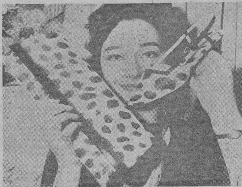
Paris.—En la colección Primavera-Verano, presentada por la firma Christian Dior, han llamado poderosamente la atención estas sandalias y el bolso, confeccionado en piel de ternera.

Moderno laboratorio Televisión con técnicos especializados. — Reparaciones garantizadas y comprobadas con modernos aparatos de medida. Calatravas, 1