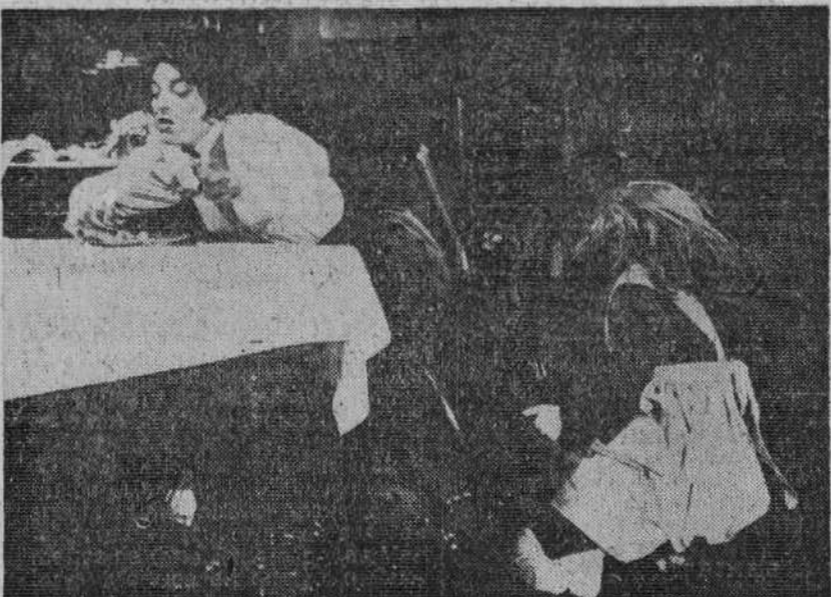
"El milagro de Ana Sullivan", premio de la Oficina Internacional Católica de Cine en el Festival de San Sebastián

Trazar en cinco artículos un panorama crítico de las tendencias actuales que se observan en el cine mundial equivale más a sugerir que a estudiar, más a suscitar interés por el tema que a desarrollarlo y habrá que acudir al esquema y a los juicios concretos, sin posibilidad de divagaciones que tal vez fueran necesarias.